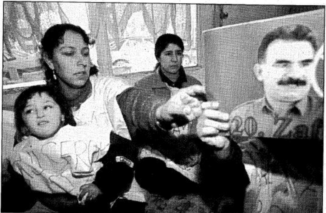
□ صوفيا، بلغاريا. مجموعة من الأكراد تحمل صورة عبدالله أوجلان زعيم حزب العمال الكردستاني عند عهدهم من الطعام بنادي الحزب في صوفيا، وسوف تقوم مجموعة من الأكراد من بينهم ستة ناطق بالإضراب عن الطعام احتجاجاً على تسليم أوجلان في كينيا وإعادته في تركيا لحاكمته.

القانونية لمحاربة هذا التطبيع في اليونان وخارجها، وأوضح، «دعم بشكل جازم قيادة حزب العمال الكردستاني (كردي تركي انضغالي) الذي نظم هذه الحركة ونفذته ضد أهداف يونانية، إن تأمر فوراً انضمامها بالانسحاب من الأرض اليونانية. وأشار بانغالوس إلى أن اليونان «سمحت لأسباب إنسانية مخدعة بتزويد الطائرة التي كانت تقل عبد الله أوجلان، بلوقود في مطار يقع غرب اليونان قبل نحو عشرة أيام». وشدد الوزير اليوناني على أن بلاده سمحت له لاحقاً بالتوجه إلى كينيا والأقامة لمدة ١٢ يوماً في مقر السفير اليوناني في نيروبي، لأسباب إنسانية، أيضاً. وكانت السلطات الكينية قد رفضت صباح أمس الثلاثاء تأكيد وجود زعيم حزب العمال الكردستاني عبد الله أوجلان في أراضيها. ورفضت قيادة الشرطة في نيروبي وزارة الخارجية الكينية في اتصال مع وكالة فرانس برس تأكيد اعتقال أوجلان. وقال المتحدث باسم الشرطة الكينية في نيروبي لوكالة فرانس برس، «اطلعت على تقارير الشرطة ولا نملك أي معلومات عن هذا الموضوع». وفي السفارة اليونانية في نيروبي أعلن موظف يعمل في مجال الأمن لوكالة فرانس برس في اتصال هاتفي معه، «إنه لا يعرف شيئاً عن أوجلان لكن مآزوره المصحف طوال الشهرين الماضيين».