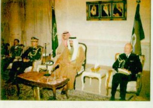
الأمير سلطان لدى استقباله للمحققين العسكريين □

□ الرياض - حائل، واس: استقبل صاحب السمو الملكي الأمير سلطان بن عبدالعزيز آل سعود الثاني رئيس مجلس الوزراء وزير الدفاع والطيران والمفتش العام في مكتب سموه بالعتر المحققين العسكريين للتحقق من لدى المملكة الذين قدموا للسلام على سموه وتهنئته بالاحتفال بمرور مائة عام على تأسيس المملكة العربية السعودية على يد جلالة الملك عبدالعزيز بن عبدالرحمن الفيصل «طيب الله ثراه». بعد ذلك ارتحل صاحب السمو الملكي الأمير سلطان بن عبدالعزيز آل سعود، ولي العهد، إلى الرياض لاستقبال وزير الخارجية اليمني اليقية ص ٢٩