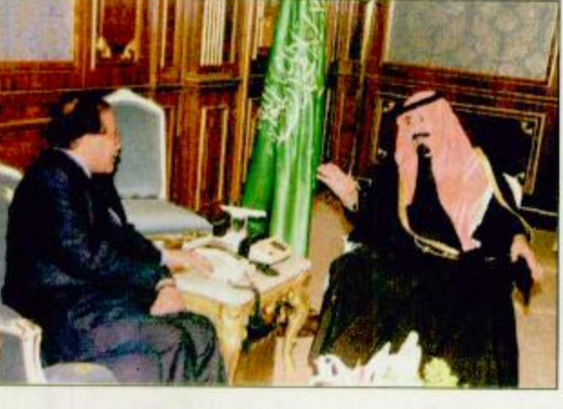
سمو ولي العهد لدى استقباله وزير الخارجية اليمني □

□ الرياض - عبد الرحمن المصبيح، واس: يرعى بمشيئة الله تعالى صاحب السمو الملكي الأمير عبد الله بن عبدالعزيز ولي العهد نائب رئيس مجلس الوزراء ورئيس الحرس الوطني حفظه الله الحفل الختامي لمدارس الرياض الذي ستقومه الساعة الثامنة والنصف مساء اليوم الأربعاء الموافق ١٧/٢/١٩٩٩. وهذه المناسبة صرح صاحب السمو الملكي الأمير سلمان بن عبدالعزيز أمير منطقة الرياض ورئيس الفخري لمدارس الرياض أن تلك الرعاية الأبوية من لدن سمو ولي العهد حفظه الله تأتي امتداداً لليقية ص ٢٩، التفاصيل ص ١١، ١٠.