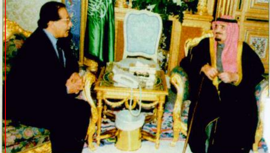
□ الرياض - واس: تلقى خادم الحرمين الشريفين الملك فهد بن عبدالعزيز - حفظه الله - رسالة من فخامة الرئيس عبد الله صالح رئيس الجمهورية اليمنية. وقام بمقتضى الرسالة لخادم الحرمين الشريفين معالي نائب رئيس مجلس الوزراء وزير الخارجية بالجمهورية اليمنية عبد القادر باجمال خلال استقباله - ابرهه الله - له في مكتبه بقصر اليمامة مساء أمس. اليقية ص ٩