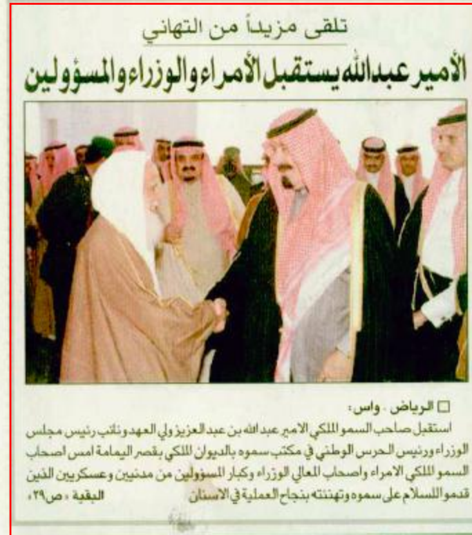
تلقى مزيباً من التهانى الأمير عبدالله يستقبل الأمراء والوزراء والمسؤولين

الرياض - عبد الرحمن المصبيح واس: أهدى صاحب السمو الملكي الأمير عبد الله بن عبد العزيز ولي العهد ونائب رئيس مجلس الوزراء ورئيس الحرس الوطني والرئيس الأعلى لمجلس إدارة مكتبة الملك عبد العزيز العامة مكتبة الملك عبد العزيز العامة بالرياض مجموعة نادرة من الوثائق والكتب النادرة الخاصة بتاريخ الملك عبد العزيز آل سعود طيب الله ثراه وتاريخ المملكة العربية السعودية لتكون ضمن مقتنيات قاعة الملك عبد العزيز بالمكتبة خدمة للباحثين والاهتمام بتاريخ الجزيرة العربية عامة وتاريخ المملكة العربية السعودية في عهد الملك المؤسس عبد العزيز بن عبد الرحمن الفيصل آل سعود طيب الله ثراه على وجه الخصوص. صرح بذلك لوكالة الأنباء السعودية فيصل بن عبد الرحمن بن معمر وكبير الحرس الوطني للشؤون الثقافية والتعليمية والنشر العام على المكتبة.