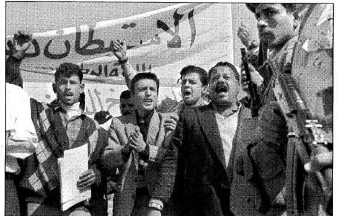
شرطة فلسطينية تحمي بعض المظاهرات الذين يرددون هتافات معادية لاسرائيل تظاهروا بالقرب من مستوطنتي جوسن كاتيف وكترامور للاسرائيليين احتجاجاً على سياسة الاستيطان الاسرائيلية.