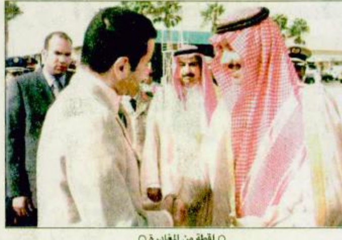
لقطة من المغادرة

الطائف - واس : غادر صاحب السمو الملكي الأمير رشيد الحسين الثاني محافظة الطائف أمس بعد أن رأس وفد المملكة المغربية في افتتاح المخيم الكشفي العربي الرابع والعشرين الذي تستضيفه المملكة في محافظة الطائف.