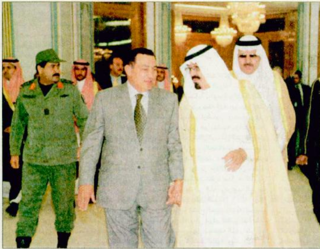
الأمير عبد الله يقيم حفل غداء للرئيس حسني مبارك