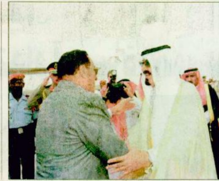
لقطات من وصول الرئيس المصري محمد حسني مبارك للطائف