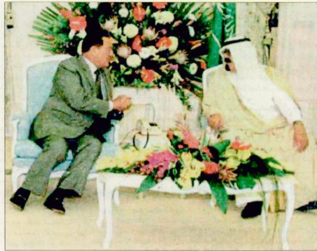
سمو ولي العهد والرئيس المصري