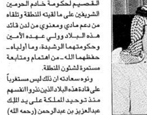
وعبر سعادته بهذه المناسبة عن عميق شكر وامتنان اهالي منطقة

كلمة مدير عام مصلحة المياه والصرف الصحي بمنطقة القصيم م. عبد الكريم بن محمد الفوزان بمناسبة زيارة صاحب السمو الملكي الامير عبدالعزيز آل سعود لمنطقة القصيم. ابدى سعادة مدير عام مصلحة المياه والصرف الصحي المهندس عبد الكريم بن محمد الفوزان سروره وحبوره بالزيارة المرتقبة التي يعترم صاحب السمو الملكي الامير عبدالله بن عبدالعزيز ولي العهد ونائب رئيس مجلس الوزراء ورئيس الحرس الوطني القيام بها لمنطقة القصيم.