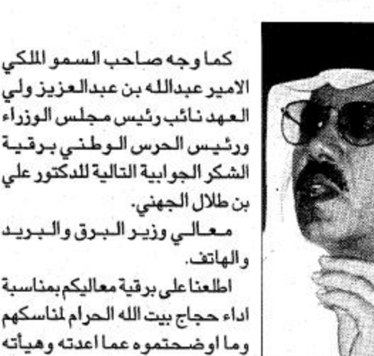
محمد بن عبد الله السبيل

للخدمات التي قدمتها الوزارة في موسم الحج خادم الحرمين وسمو ولي العهد يشكران د. الجهني والعاملين في مجال الاتصالات جدة-واس: وجه خادم الحرمين الشريفين الملك فهد بن عبدالعزيز آل سعود حفظه الله بقرينة شكر جوابية فيما يلي نصها. معالي وزير البترول والبريد والهاتف. اطلنا على بقرينتك بمناسبة اداء حجاج بيت الله الحرام لمناسكهم وايضا حكام عما قامت به الوزارة من استعدادات مكثفة لكافة قطاعاتها للمشاركة في تقديم افضل خدماتها الهاتفية والتلكسية والبرقية والبريدية لحجاج بيت الله الحرام.