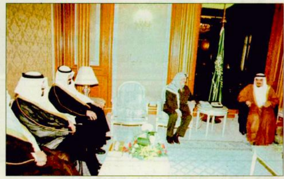
خادم الحرمين الشريفين لدى استقباله الرئيس الفلسطيني