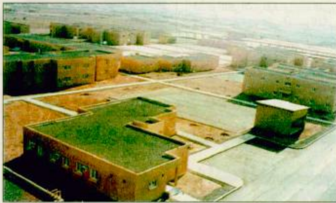
المشروعات التي تم افتتاحها في المدينة المنورة ولواء الملك فيصل