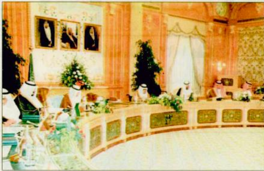
تقف مع الشرعية فيما يتعلق بالظروف الراهنة التي تمر بها جمهورية باكستان الاسلامية.

واقف معالي وزير الإعلام فؤاد بن عبدالسلام الفارسي في بيانه لوكالة الأنباء السعودية عقب الجلسة ان سمو ولي العهد عرض ويتوجه كريمة إلى مظاهر الحفاوة والتجانب والتكريم الذي لقيته المملكة من اخوانه قادة تلك الدول وما يكونه لخادم الحرمين الشريفين الملك فهد بن عبدالعزيز وشعب المملكة من الود والالتفات والتقدير. وأعرب سمو ولي العهد عن شكره وامتنانه لاخوانه قادة تلك الدول على الحفاوة وحسن الاستقبال اللذين لقيتهما سموه والوفد الرفاق خلال جولته الاخيرة.