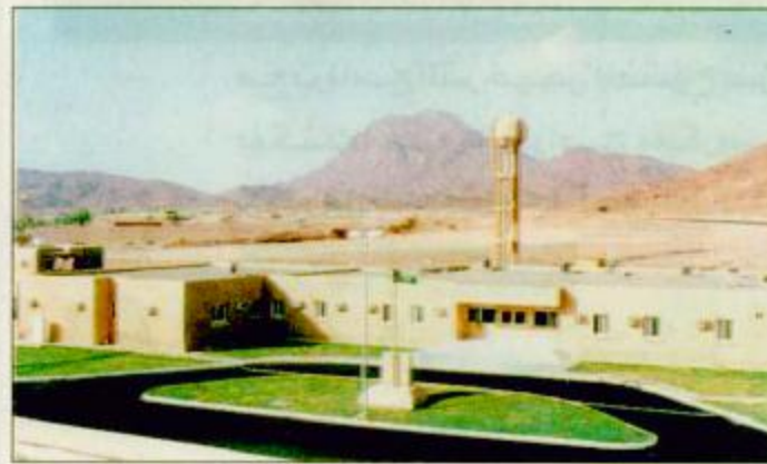
منشآت لواء الملك فيصل بالمدينة المنورة

الرياض - الجزيرة: بمناسبة الله تعالى يرعى صاحب السمو الملكي الأمير عبدالله بن عبدالعزيز ولي العهد نائب رئيس مجلس الوزراء رئيس الحرس الوطني ظهر غدا الأربعاء افتتاح منشآت لواء الملك فيصل بالمدينة المنورة وينبع والتي تمثل لبنة جديدة في عملية التشييد والبناء المستمر لكافة أجهزة وقواعد الحرس الوطني.