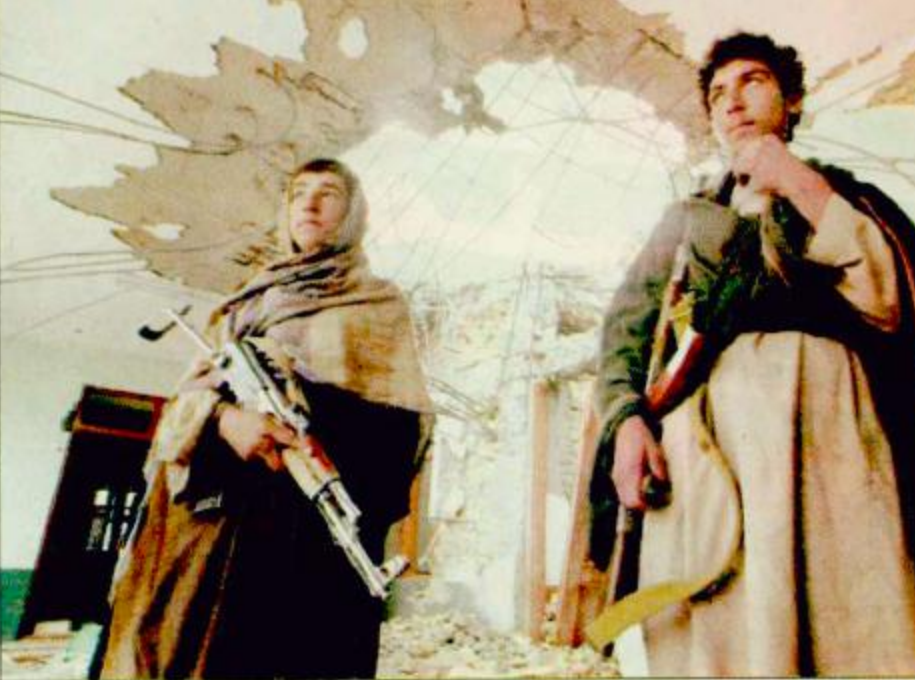
قندهار - (أ-ب): مقاتلان موليان لحاكم قندهار قول أفا يقفان وسط حمامة وانقاض مجمع سكني كان يقبع فيه الملا عمر.

تحدثت تقارير المعارك في أفغانستان عن تقدم تحزبه القوات الأفغانية على جبهة تورا بورا وسط أنباء عن مصرع واعتقال العشرات من مقاتلي تنظيم القاعدة واستمرار القصف الأمريكي العنيف في وقت بدأ فيه أن المساعي الأوروبية نحو عدم توسيع نطاق الحرب لتشمل دولا أخرى بدأت تتبلور في شكل دعوة رسمية من الاتحاد الأوروبي. فقد قالت مسودة بيان قمة الاتحاد الأوروبي أن الاتحاد حث الولايات المتحدة أمس السبت على عدم تنفيذ حربها ضد الإرهاب إلى ما وراء أفغانستان دون الحصول على موافقة المجتمع الدولي. وقال نص مسودة البيان الذي حصلت رويترز على نسخة منه موافقة المجتمع الدولي ضرورية قبل أي توسيع جغرافي لهذه العمليات، ويجب أن يقر زعماء الدول الأعضاء في الاتحاد الأوروبي ومجموعهم 15 دولة الوثيقة في جلستهم الختامية. ويجتمع الزعماء في القصر الملكي في لندن ببروكسل. ويساند الاتحاد الأوروبي بقوة الحملة الأمريكية بالرغم من أن بريطانيا هي الدولة الأوروبية الوحيدة التي لعبت دوراً عسكرياً مباشراً إلا أن مسؤولين أوروبيين يخشون أن يسعي متشددون في واشنطن إلى شن هجمات على دول أخرى يعتقد أنها تآوي إرهابيين أو تمثل تهديداً للمصالح الأمريكية مثل اليمن أو السودان أو العراق.