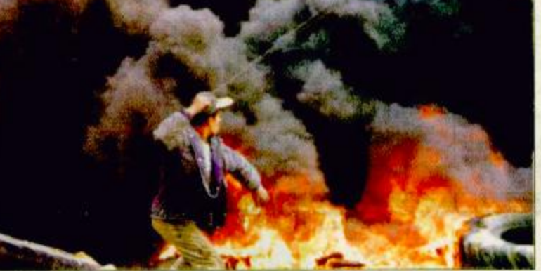
شاب فلسطيني يستخدم الفلج لرحم الدبابات الإسرائيلية تحت ستار من الإطارات المحترقة

أقترحته الدول العربية على مجلس الأمن الدولي يدعو إلى حماية الفلسطينيين وإرسال مراقبين دوليين إلى المناطق الفلسطينية أو إقامة آلية إشراف لتطبيق تقرير لجنة ميتشل. وقال نيسل أبو رديته مستشار عرفات: نحن ندين هذا القرار بشدة واعتبر أبو رديته أن القرار لن يخدم عملية السلام ولا الاستقرار في المنطقة.