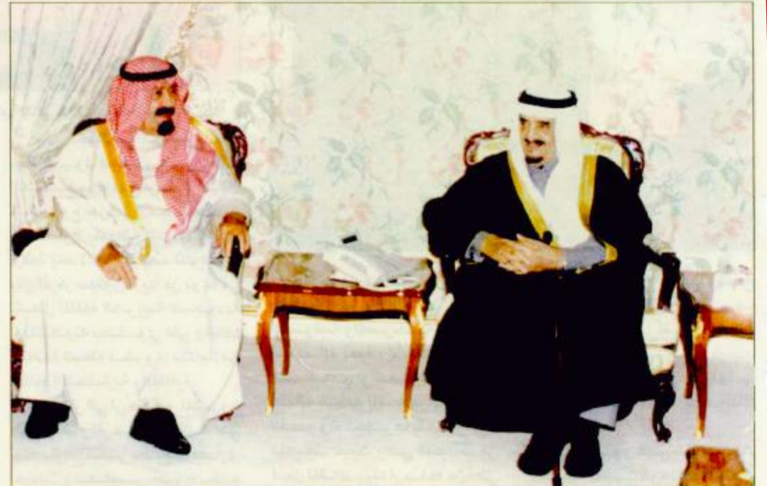
خادم الحرمين وولي العهد ومشاورات دائمة لمصلحة المواطنين والامة الإسلامية

خادم الحرمين وولي العهد والنائب الثاني والقادة العرب يتبادلون التهاني بعيد الفطر المبارك ص 7/5