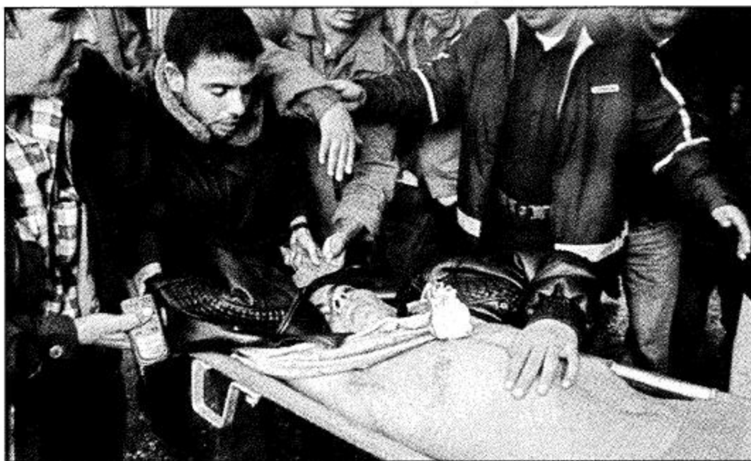
بيت حانون فلسطينيون يقومون بإخلاء زميل جريح أصيب برصاص الإسرائيليين في ضواحي بيت حانون شمال غزة.

جديد على قطاع غزة يوم الجمعة، وقال بيسان للاتحاد الأوروبي صدر خلال اجتماع قمة في بروكسل ان «إسرائيل تحتاج شريكا للتفاوض معه من أجل القضاء على الإرهاب والعمل من أجل السلام... وهذا الشريك هو السلطة الفلسطينية ورئيسها المنتخب ياسر عرفات». وصرح مسؤولون فلسطينيون بان التحركات الإسرائيلية تصل إلى