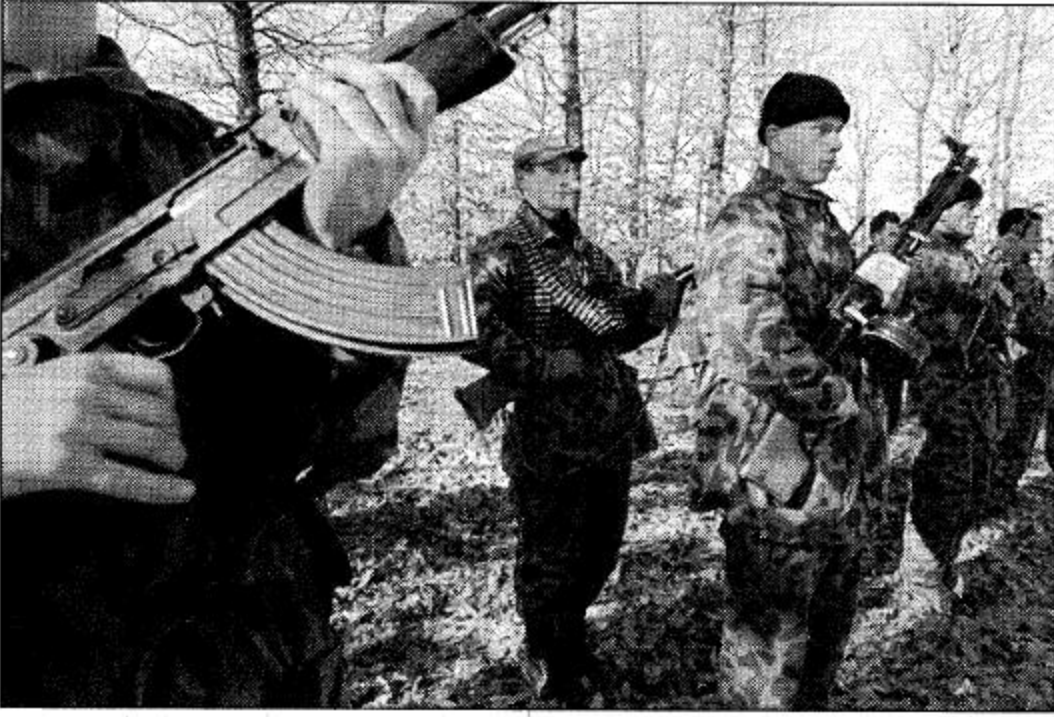
جنود جيش تحرير كوسوفو في حالة تأهب أثناء تدريب في الجبال بالقرب من جورتيا بإقليم شمال العاصمة الكوسوفية بريشتينا.