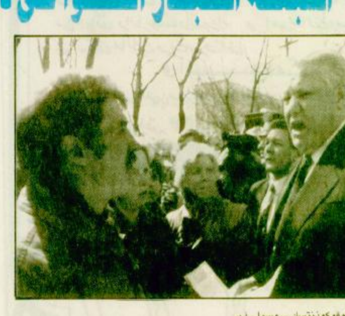
نوفوكونستك روسيا - ب - الرئيس الروسي بوريس يلتسين وقد اسط بيده مشورتا معسدية له يفضحت الى اجتماع حاشد معاد للرئيس في قلند مدينة نوفوكونستك