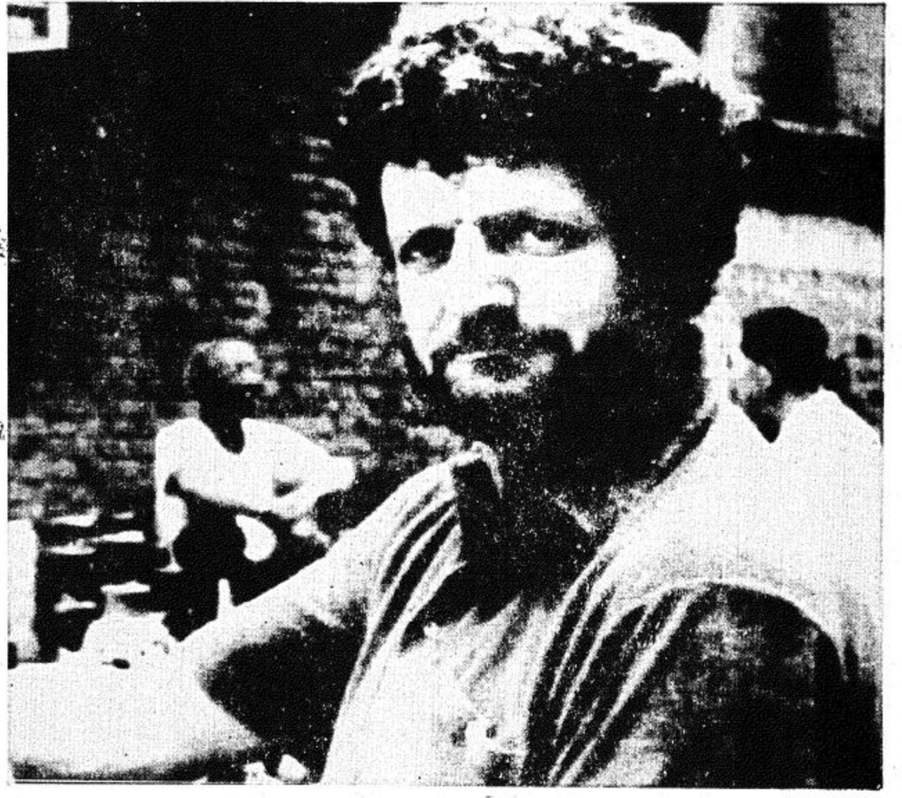
□ نيويورك - أ ب مراسل صحيفة النيويورك تايمز جون ف. برينز فاز بجائزة بوليتزر للصحافة عن التغطية الدولية لنشجاعة وتغطيته الشاملة للدمار الذي لحق بسرائيفو وأعمال القتل الوحشية التي ارتكبتها الصرب في الحرب البوسنية