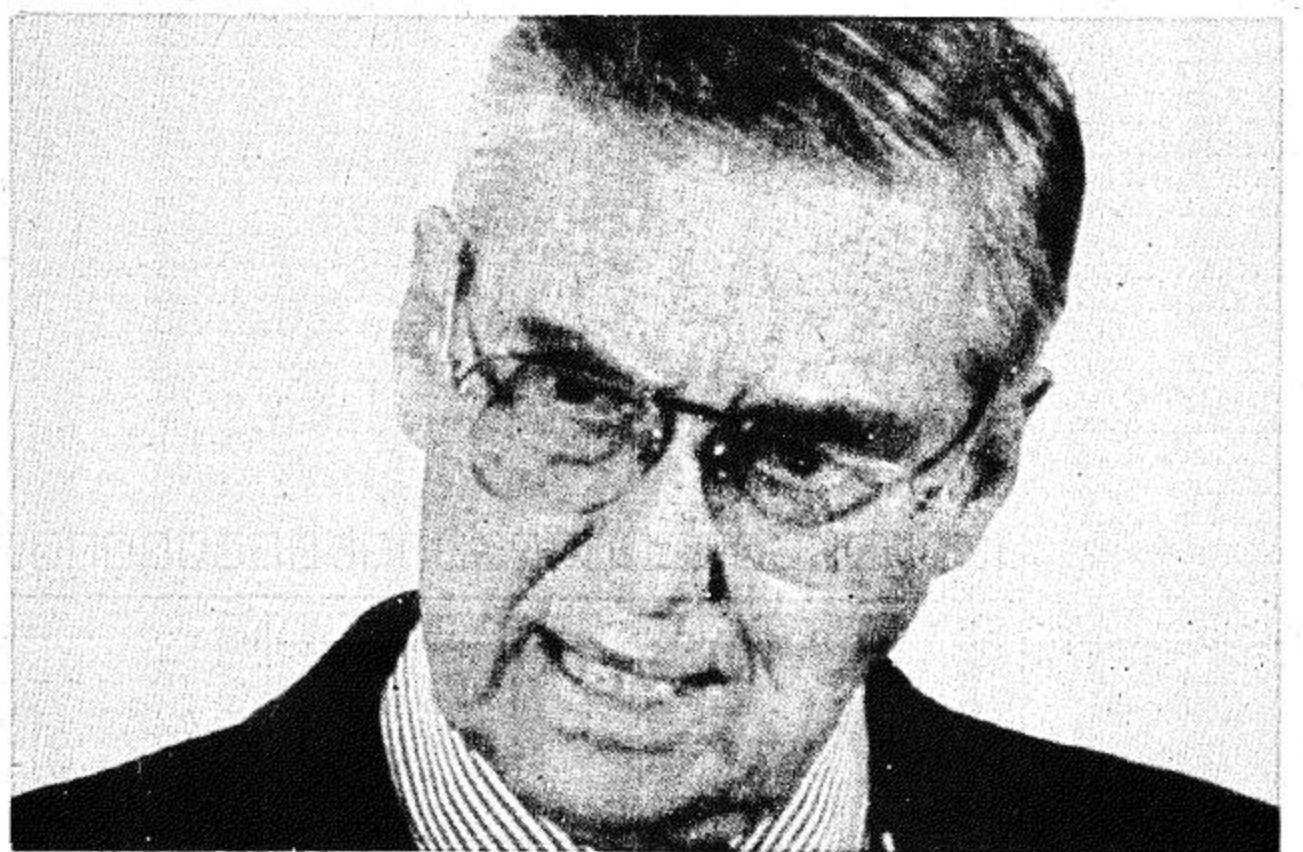
أ ب طوكيو - أ ب وزير الخزانة الأمريكية لويدي بنتسبن يشعريده اثناء المؤتمر الصحفي الذي عقد يوم الثلاثاء الماضي في طوكيو حيث قل من الواضح انه يجب ان يكون هناك بعض الاتفاق للمساعدة في نجاح الاجراءات الاقتصادية للرئيس بنتسبن