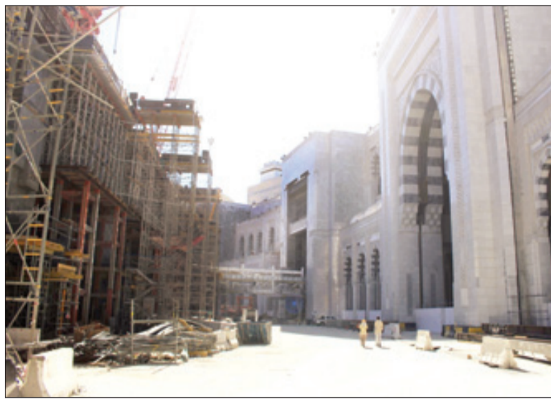
باب الملك عبدالله أعلى أبواب الحرم المكي