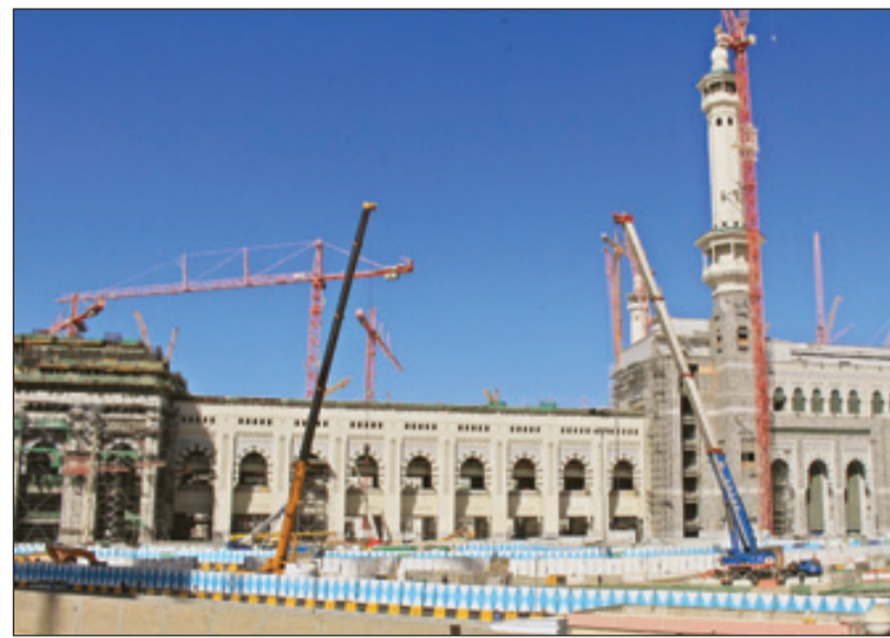
توسعة الملك عبدالله أكبر توسعة للحرم المكي الشريف