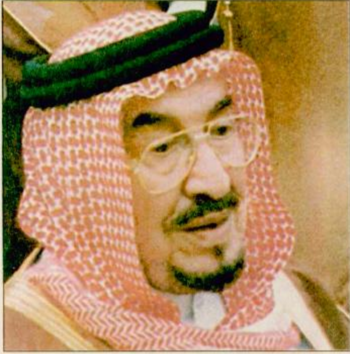
الأمير متعب بن عبدالله:

هل تواصل الصاروخية بسيمة، تفوقها على جيايد الانتاج عصر اليوم وتكون ليلة فرح زرقاء (بالاسطبل الأزرق) لم يغير البشر ورفاقه اتجاه الذهب ناحية (الاسطبل الأبيض) ويكون ليها بيضاويا.. والاسطبل الأخضر والله ابها ربما تكون هالاسطبل والسبي تعشقها احلى وابهى.