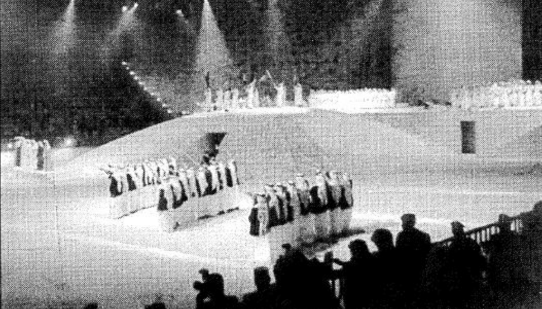
الأميرة عبطة في حفل افتتاح الجنادرية 15

عربي اصيل نجح نجاحا كبيرا ليس على مستوى المملكة فحسب بل على مستوى العالم في التعريف برواق اجسادنا وعرض تراثنا الذي يجسد البيئة القديمة بشكل جاذب للنظر وفي مناسبة وطنية عزيزة بلتحم فيها أبناء الوطن في اطار العادات والتقاليد العريقة لربط الماضي بالحاضر.