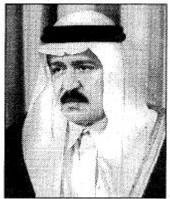
○ الأمير محمد بن سعود