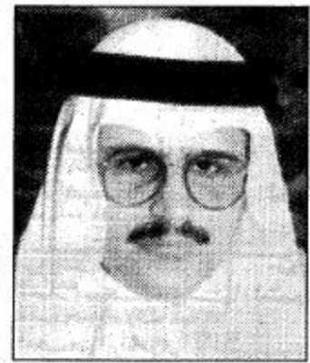
○ الأمير فيصل بن محمد بن سعود

الباحة - واس: رفع صاحب سمو الملكي الأمير محمد بن سعود بن عبدالعزيز أمير منطقة الباحة باسمه وباسم أبناء منطقة الباحة أبلغ التهاني لخادم الحرمين الشريفين الملك فهد بن عبد العزيز بمناسبة وصول سموه الملكي الأمير سلطان بن عبدالعزيز النائب الثاني لرئيس مجلس الوزراء ووزير الدفاع والطيران والمفتش العام إلى أرض الوطن بعد أن مرَّ الله تعالى على سموه بالشفاء والعافية. وأشار سموه في برقيته التي أن عودة سمو النائب الثاني إلى وطنه معاني كان لها أكبر الأثر في نفوس المواطنين ما هي إلا تجسيد لواقع الانتعاش والتضحية في نفس كل مواطن ومواطنة تجاه هذا الكيان الشامخ وقيادته الرشيدة. ودعا سموه الله تعالى أن يحفظ للمملكة أمنها واستقرارها ويديم عليها عزها وأن يمد خادم الحرمين الملكة أسرة واحدة تستظل تحت راية الحب والخير التي رفع دعائهما للوحد وسار على نهجه من بعده