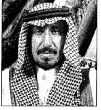
○ الأمير مشعل بن سعود