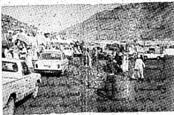
● يتفقد حركة السير في الأربعة منى

ويقول عن السبب: إنه اهتمام جلالة الملك العظيم وخيمه ججاج بيت الله الحرام والجهود التي تبذلها الحكومة لذلك ونتيجة للتجربة التي أمضوها في العام الماضي وهم جاهلون ببعض أعمال المرور والشكر الذي جاءهم من سمو سيدي نائب وزير الداخلية وسمو سيدي الأمير فواز بن عبد العزيز أمير منطقة مكة المكرمة وسمو سيدي الأمير أحمد بن عبد العزيز وكيله ومن ميسر الأمن العام وهذا زاد الأفراد ثقة ورغبة في العمل لأن الرغبة كانت أكيدة والشكر دفعهم أكثر للعسل وهذا العام بالإضافة إلى كثرة الحجاج والبريات الإحظ التهم يؤدون العمل أكثر وعن ثقة ٠٠