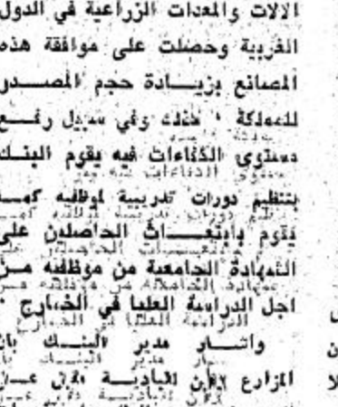
في ادارة البنك مساهم في مجلس الادارة او في ادارة الفروع يسعون باخلاص لجعل هذه المؤسسة مثلا يحتذى به في تلبية احتياجاتهم وقد قامت بعثة من البنك بزيارة مصانع

عقد في عانة المندوبات لمرسة الشارقة بريدة .. اجتماع لوزراء التربية والتعليم والادارة والرياسة لدراسة اوضاع التربية في المنطقة بريدة - مكتب الجزيرة