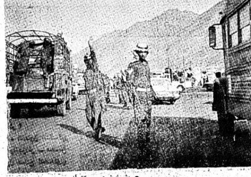
● يشرف الأمير على حركة السير