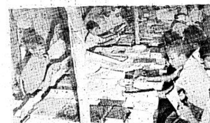
● مكتبة عامرة لتبني استشاريين

للحرس الوطني قصد تحركت من الرياض متجهة إلى الديار المقدسة في العشرين من الشهر الماضي ووصلنا يوم ٢٣ إلى مكة المكرمة ٠٠ وديانا في إعادة تنظيم الحملة ثم عسكرنا في دقم الورد يوم ٢٥ وبعنا الأفراد على المفازين وابتدانا في تنظيم الأعمال المرورية ٠٠ وكان صاحب السمو الملكي الأمير بدر بن عبد العزيز نائب رئيس الحرس الوطني قد قام في عصر اليوم الثالث من ذي الحجة برافقه بعبادة وكيل الحرس الوطني في المنطقة الغربية الشيخ محمد العبدان وسعادة نائب العمليات في المنطقة الغربية اللواء علي الشهيب، ومدير عام مكتب سمو رئيس الحرس الوطني الشيخ خالد الشلهوب بجولة تفقدية في الشارع المقدسة حيث زار سموه في بداية جولته معسكر قوة مدارس الحرس الوطني العسكرية والقلبية في منى حيث استقبل سموه عند توبه أمير المدارس العسكرية والقلبية بالحرس الوطني اللواء مصلح بن أحمد القحطاني واللواء عبد العزيز الجيدان قائد قوات أمن الحج، وغد من الضباط ٠٠ وبعده ان استعرض سموه أفراد القوة قام أفراد المدارس بشرح مفصل عن الخطة المكلفة بها قوة المدارس العسكرية والقلبية، ثم ارتحل سمو الأمير بدر بن عبد العزيز كمنه في أفراد القوة الذين يتجاوز عددهم إلى ٤٠٠ فرد ٠٠ قال فيها سموه / الذي مكثتكم بالكم تعلمون أن حضوريكم هنا إنما هو لخدمة ضيوف الرحمن سبحانه وتعالى والسني أوصيكم به هو الجد والاجتهاد في عملكم ومعاملة ضيوف بيت الله الحرام بالرفق ٠٠ ولا شك في أن كل فرد منكم يعرف واجبه، كما أوصيكم بتعاونكم وانضباطكم مع