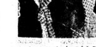
الآنسة (١) عليهن

تبدأ امتحانات الشهادات العامة يوم الخميس ٢٥ جمادى الأولى ٩٥ هـ اما امتحان التربية العملية لكافة معاهد المعلمين يوم السبت ١٠ ربيع الأول ٩٥ هـ وتنتهي في موعد غايته الخميس ٢٢ ربيع الأول ٩٥ هـ وابتداء امتحان التربية العملية لثانوية معاهد المعلمين يوم السبت ٢٤ ربيع الأول وتنتهي في مواعيد غايته يوم الأحد ٩ ربيع الثاني ٩٥ هـ اما الامتحانات العملية لمادتي التربية النسوية والتربية الفنية تستعدا بالنسبة للنقل لجميع المراحل المقررة عليها هاتان المادتان يوم السبت ٢٤ ربيع الأول وتنتهي في موعد غايته يوم الخميس ١٢ ربيع الثاني وتبدأ امتحانات الشهادات لمادتي التربية النسوية والتربية الفنية لجميع المراحل المقررة عليها هاتان المادتان يوم السبت ٢٤ ربيع الأول وتنتهي في موعد غايته يوم الخميس ١٢ ربيع الثاني وتبدأ امتحانات الشهادات لمادتي التربية النسوية والتربية الفنية لجميع المراحل المقررة عليها هاتان المادتان يوم السبت ٢٤ ربيع الأول وتنتهي في موعد غايته يوم الخميس ١٢ ربيع الثاني