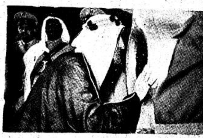
لغات من موسم الحج لعدد من السياح