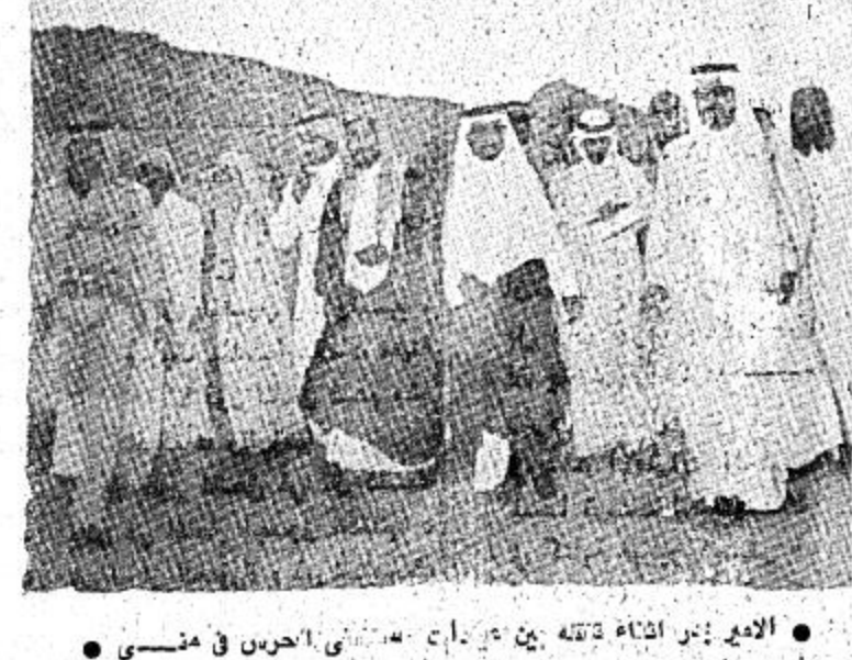
● الأمير بن عبدالعزيز يتقبل من رجال الحرس في منى

وللحقيقة أكتب أن رجال الحرس الوطني كان لهم دور بارز وعظيم في موسم حج هذا العام وإن ذكرت الجهات التي أسهمت بهذا الدور فإن الحرس الوطني يحتل بجدارة مكانة ممتازة بين هذه الجهات ٠٠ فقد شارك أكثر من أربعين ضابط وضابط صف وطالب من قوة المدرسة العسكرية للحرس الوطني في حج هذا العام ووزعت المجموعة على مفازين في كسل شارع سدة طرير والاهل بالشباب كل أربع ساعات وعند الضغط تتحرك كامل الفرزة التي تتكون في الداخل من حوالي ٣٥ طالبًا وفي نهاية الخط لا تقل عن ٢٠ طالبًا وبعض المفازين تتكون من ١٥ طالبًا ٠٠