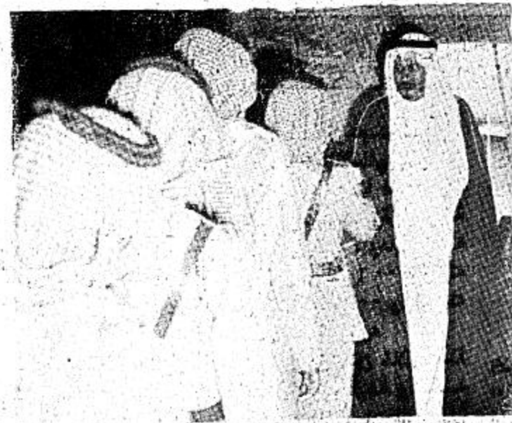
● سمر الأمير بدر بن عبد العزيز يتقبل التهنئة من رجال الحرس