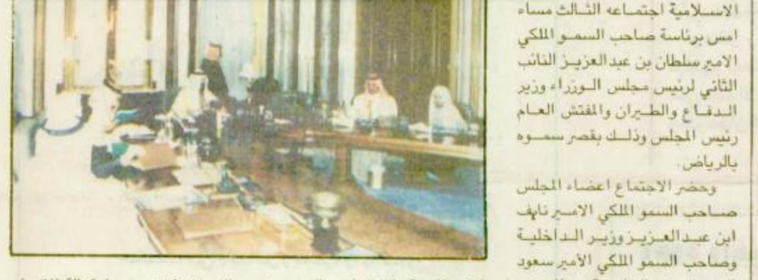
عقد المجلس الاعلى للشئون الاسلامية اجتمعا الثالث مساء امس برئاسة صاحب السمو الملكي الامير سلطان بن عبدالعزيز النائب الثاني لرئيس مجلس الوزراء وزير الدفاع والطيران والمفتش العام رئيس المجلس وذلك بقصر سموه بالرياض. وحضر الاجتماع اعضاء المجلس صاحب السمو الملكي الامير تاهب ابن عبدالعزيز وزير الداخلية وصاحب السمو الملكي الامير سعود الفيصل وزير الخارجية ومعالي وزير المالية والاقتصاد الوطني الاستاذ محمد ابوالخيل ومعالي وزير التعليم العالي الدكتور خالد بن محمد العنقري ومعالي وزير العدل الدكتور عبد الله بن محمد بن ابراهيم ال الشيخ ومعالي وزير الشؤون الاسلامية والاوقاف والدعوة والارشاد الدكتور عبد الله بن عبد المحسن التركي والامين العام لجماعة العالم الاسلامي الدكتور احمد عدي. وعقب الاجتماع اوضح امين عام المجلس الدكتور عبدالعزيز ابراهيم