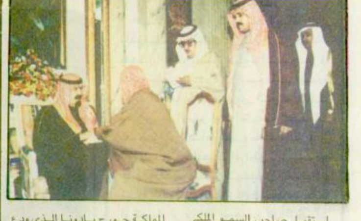
استقبل صاحب السمو الملكي الأمير عبد الله بن عبد العزيز ولي العهد نائب رئيس مجلس الوزراء ورئيس الحرس الوطني في الديوان الملكي بقصر اليمامة بعد ظهر امس اصحاب الفضيلة العلماء والمشايخ - واصل - استقبل صاحب السمو الملكي الأمير عبد الله بن عبد العزيز ولي العهد نائب رئيس مجلس الوزراء ورئيس الحرس الوطني في مكتبه بالديوان الملكي في قصر اليمامة بعد ظهر امس سفير جمهورية كوريا الذي