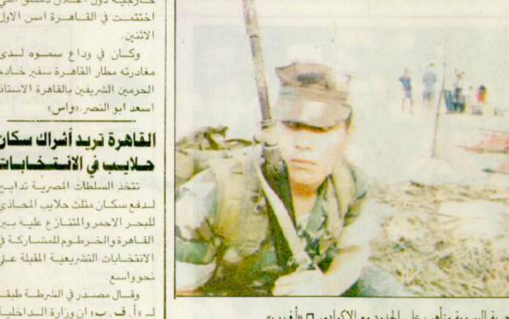
احد رجال المشاة البحرية البيروية مناهب على الحدود مع الاكوادور «أغذب»

اوردت احدي الاذاعات في البيرو ان الجيش نقل حوالي الف رجل الى سان ايتاسيو على بعد حوالي ٢٠٠ كلم الى جنوب غرب المنطقة التي تدور فيها المارك منذ ١٢ يوما بين جيش البيرو وجيش الاكوادور. وقال مراسل (اذاعة بروغرامس) الموجود في تلك المنطقة ان هذه القوات التي وصلت مساء الاثنين الى هذه المنطقة التي تبعد بضعة كيلومترات عن الحدود مع الاكوادور تجتمع في معسكر فوق الغابة الخامسة. وقالت مصادر عسكرية لهذا المرسل طبقا لـ أ. ف. ب. ان الهدف من نقل هذه التعزيزات هو مواجهة اي استفزاز من قبل الاكوادور في الوقت الذي تقتحم قوات البيرو موقع تيوسرا الذي