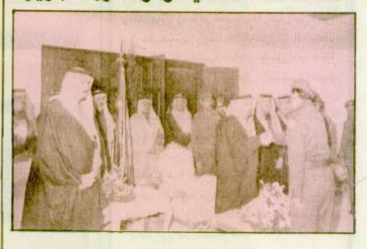
استقبل خادم الحرمين الشريفين الملك فهد بن عبد العزيز آل سعود القائد الاعلى للقوات المسلحة - حفظه الله - في مقر اقامته بمدينة الملك خالد العسكرية الليلة الماضية قادة وضباط المنطقة الشمالية وقوة