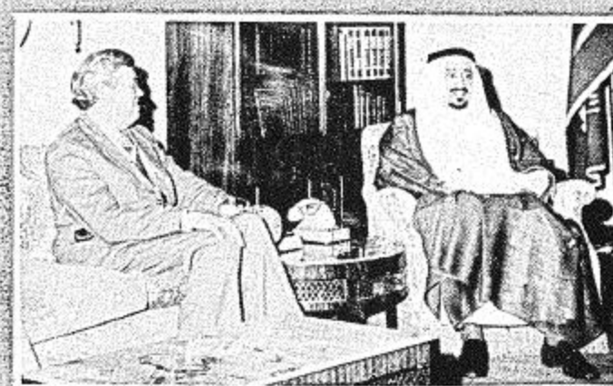
• نائب رئيس وزراء نيوزيلندا مع جلالة الملك