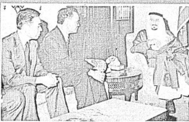
• نائب وزير المواصلات الصيني مع جلالة الملك

بعد سبع ساعات من التراب حيث كان الجميع هنئا يعطون باجيزة التلفزيون معرفة نتائج الانتخابات التي كانت تنقلها محطات التلفزيون المختلفة .. أصبح الرجل الذي يزعج الفول السوداني في سول جورجيا والذي كان غير معروف للجمهور منذ اقل من عام الرئيس المنتخب للولايات المتحدة .. وبهذا يكون جيمي كارتر - ٥٢ سنة - الرئيس التاسع والثلاثين للولايات المتحدة .. وسوف يسلم في البيت الأبيض في ٢٠ يناير المقبل .. وقد كانت التوقعات السبقت التي حصل عليها كارتر من ولاية مسيسيبي من التي حسمت جوار الرمز السري - ٢٧٠ سنة في الميخ الانتخابي - وقد اسبح فوز كارتر مؤكدا صحة عليه بعد ان مات كنه ولاية سوري التي كان يورد متفهما لهما منال اسم سلمة وتطمين لساكنه في الساعة الثانية عشرة و ٤٥ دقيقة من صباح اليوم .. وإذراك لاهية نتيجة الانتخابات في هذه الولاية طلب منظمو الحملة