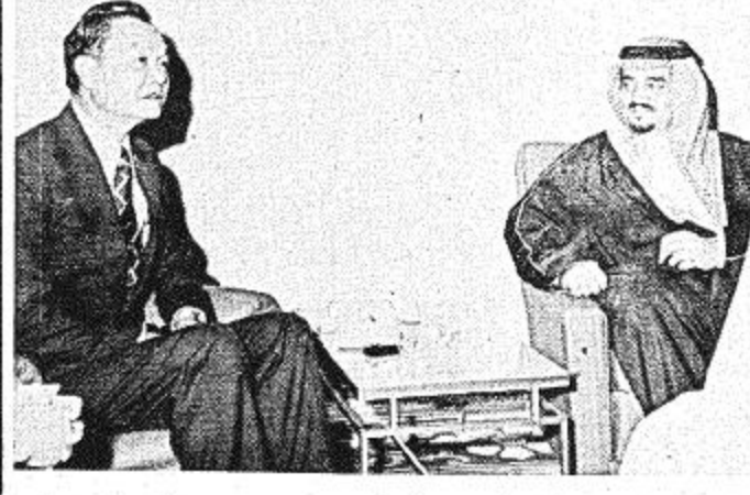
استقبل سموه ظهر أمس معالي السيد سي . سي وانج نائب وزير المواصلات الصيني والوفد المرافق له

برقية من نمرى لجلالة الملك خالد الرياض - واس تلقي جلالة الملك خالد بن عبد العزيز برفقة شكر جوابية من فخامة الرئيس السوداني جعفر محمد نمرى ردا على البرقية التي كان جلالاته قد بعث بها بمناسبة مغادرته الأراضي السودانية وقصد أكد الرئيس نمرى في برقيته أن زيارة جلالة الملك خالد للسودان جاءت تأكيداً لعق الروابط بين البلدين والشعبين الشقيقين وأعرب فيها عن تمنياته الصادقة لجلالته بدوام الصحة والهناء ولشعب المملكة باضطراد التقدم والازدهار.