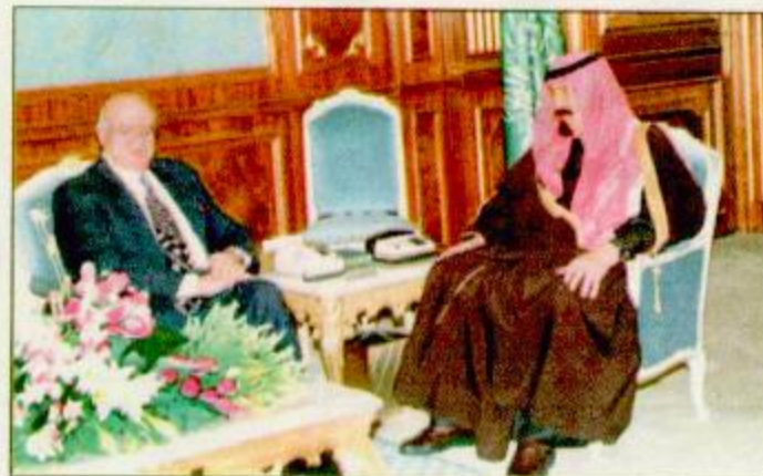
لقطات من استقبال سمو ولي العهد للسفراء الخليجيين والعرب والدول الصديقة