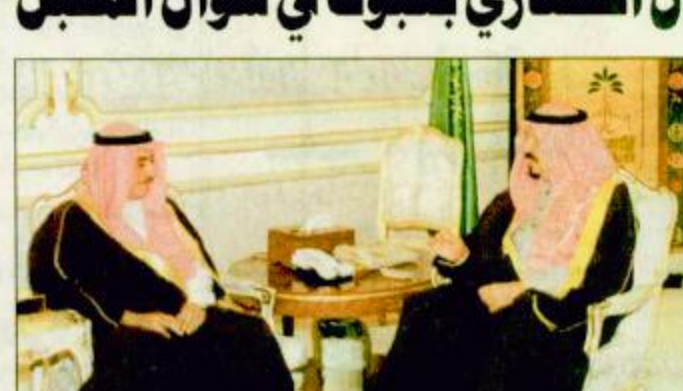
الأمير سلطان لدى استقباله وزير المالية

تبوك - الرياض: إبراهيم الشمري-واس: سيختم صاحب السمو الملكي الأمير سلطان بن عبد العزيز النائب الثاني لرئيس مجلس الوزراء وزير الدفاع والطيران والمفتش العام بوضع حجر الأساس لمشروع مركز الأمير سلطان الحضاري في تبوك أثناء زيارة سموه لمنطقة تبوك خلال إيام عيد الفطر المبارك لعلاية منسوبي القوات المسلحة بالمنطقة الشمالية الغربية وأهالي المنطقة. أعلن ذلك صاحب السمو الملكي الأمير فهد بن سلطان بن عبد العزيز أمير منطقة تبوك في تصريح لوكالة الأنباء السعودية عقب تفقد سموه أمس الموقع المشروع. وقال سموه أننا سنحتل جميعاً في هذه المنطقة الغالية من بلادنا العزيزة بتشييد صاحب السمو الملكي الأمير سلطان بن عبدالعزيز النائب الثاني