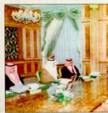
الأمير سعود الفيصل يرأس الاجتماع الوزاري البترولي

الرياض-واس: عقدت اللجنة الوزارية للبترول اجتماعاً في الديوان الملكي أمس برئاسة صاحب السمو الملكي الأمير سعود الفيصل وزير الخارجية ورئيس اللجنة وحضور أعضاء اللجنة معالي الدكتور محمد بن عبدالعزيز آل الشيخ وزير الدولة عضو مجلس الوزراء ومعالي وزير البترول والثروة المعدنية المهندس علي بن إبراهيم النعيمي ومعالي وزير المالية والاقتصاد