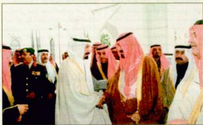
سمو ولي العهد لدى استقباله الأمراء والعلماء

الرياض-واس: استقبل صاحب السمو الملكي الأمير عبد الله بن عبد العزيز ولي العهد ونائب رئيس مجلس الوزراء ورئيس الحرس الوطني بمكتب سموه بالديوان الملكي بقصر اليمامة أمس أصحاب السمو الملكي الأمراء وأصحاب الفضيلة العلماء وأصحاب العالی الوزراء وكبار المسؤولين وكبار قادة وضباط الحرس الملكي وجمعاً من المواطنين الذين قدموا للسلام على سموه وتهنئته بحلول شهر رمضان المبارك أعاده الله على الجميع بالخير واليمن والبركات. البقية ص ٢٩