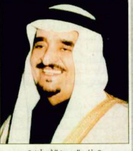
خادم الحرمين الشريفين

الرياض-واس: بعث خادم الحرمين الشريفين الملك فهد بن عبدالعزيز آل سعود برفقة تهنئة إلى فخامة الرئيس دانيال أرب موي رئيس جمهورية كينيا بمناسبة ذكرى استقلال بلاده. وأعرب الملك المفدى باسم شعب وحكومة المملكة العربية السعودية وباسمه عن اجمل التهاني والطيب الاماني بموفور الصحة والسعادة لفخامته والازدهار الدائم لشعب كينيا الصديق.