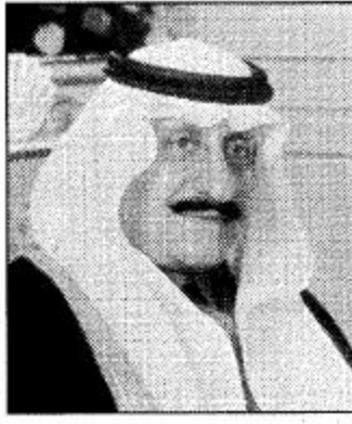
أمير الحدود الشمالية

عرب - عبدالله القارن: وصف هذا اليوم العظيم من منجزات الملك عبدالعزيز بن سعود أمير منطقة الحدود الشمالية التي تروي قصة توحيد هذا الكيان العظيم على يد المؤسس لهذا الكيان العظيم عليه الشكر والثناء والتقدير والاحترام