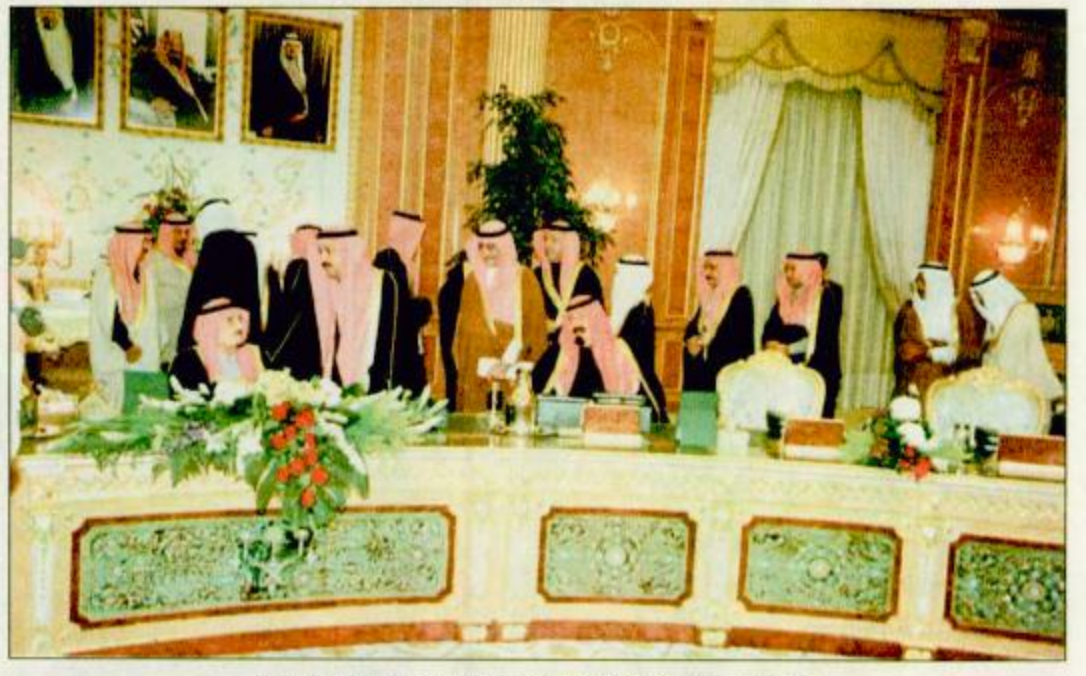
○ خادم الحرمين الشريفين لدى ترؤسه جلسة مجلس الوزراء أمس

○ الرياض - واس: رأس خادم الحرمين الشريفين الملك فهد بن عبدالعزيز آل سعود - حفظه الله - الجلسة التي عقدها مجلس الوزراء مساء أمس الاثنين بقصر اليمامة بمدينة الرياض. وجدد - حفظه الله - في مستهل الجلسة التهنئة للمواطنين وقادة الأمة الإسلامية ولجميع المسلمين في كل مكان بحلول شهر رمضان المبارك سائلاً المولى جل جلالته أن يوفقهم ويعينهم على صيامه وقيامه والتقرب إليه بالطاعات والعمل الصالح. وقال الملك المعدي: «إن شهر رمضان المبارك إضافة إلى ما خصه الله به من كتابه الكريم وما ورد في السنة المطهرة من فضائل فقد حفل الشهر الكريم بالعديد من الدروس والعبر على مر العصور الإسلامية التي تشكل مدرسة شاملة لأبناء الأمة الإسلامية عليهم البقية» ص ٢٩.