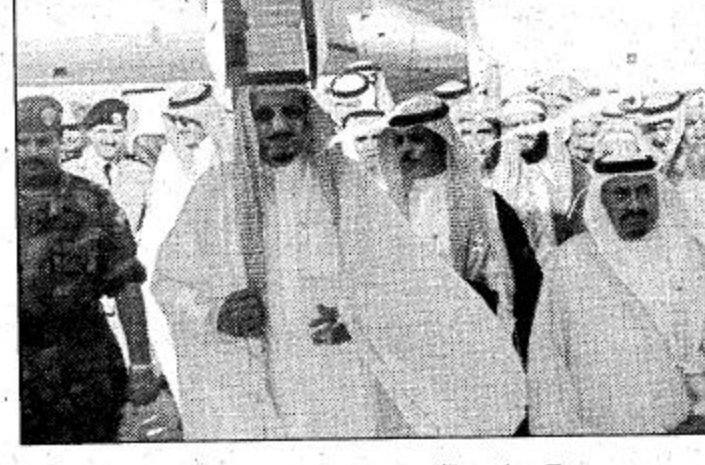
الأمير سلمان بن عبدالعزيز يشرف حفل عشاء أهالي جازان □ الصور من واس