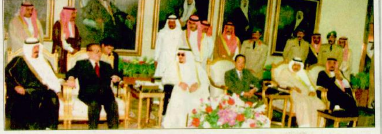
لقطات من اجتماع خادم الحرمين الشريفين واحتفائه بالرئيس الصيني

سمو ولي العهد في كلمة لدى رئاسته اجتماع المجلس الاقتصادي الأعلى: