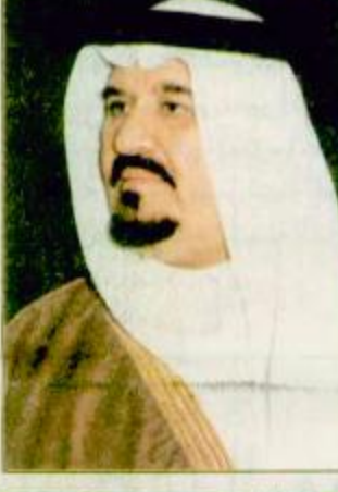
سمو النائب الثاني يستقبل السفير الإيراني

بيروت - مكتب الجزيرة الاقليمي: اشاد رئيس اللجنة التوجيهية للشؤون الخارجية في مجلس النواب اللبناني رئيس الحكومة الاسبق الدكتور امين الحافظ بموقف صاحب السمو الملكي الامير سلطان بن عبد العزيز النائب الثاني لرئيس مجلس الوزراء وزير الدفاع والطيران والمفتش العام الذي تضمن حواره مع التلفزيون البريطني وقال في تصريح خاص له الجزيرة: ليس هذا الموقف مستغرباً من سمو الامير سلطان بن عبد العزيز فلقد عرفناه في كل المناسبات حريصاً على الصلحة العربية والإسلامية العليا راسخ الايمان بعدالة قضية فلسطين باذلاً كل جهد في سبيل تحرير بلادنا من الاحتلال شامل الشعبين اللبناني والسوري بعاطفة نبيلة لسها منه كل من عوفه وذلك ضمن أسلوب يجمع ما بين الصلابة في الموقف والحكمة في معالجة الأمور. والواقع ان الملكة العربية السعودية الملكة محمد علي هادي والوفد الرفاق.