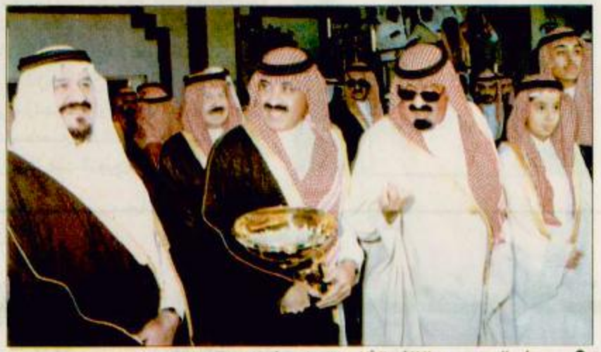
● سمو ولي العهد وسمو النائب الثاني يتابعان حفل السباق الكبير □ تصوير - حسين حمدي

كتب - عايض البقيمي: نيابة عن خادم الحرمين الشريفين الملك فهد بن عبد العزيز - يحفظه الله - رعى صاحب السمو الملكي الأمير عبد الله بن عبد العزيز ولي العهد نائب رئيس مجلس الوزراء ورئيس الحرس الوطني ورئيس نادي الفروسية حفل سباق الخيل الكبير على كأس خادم الحرمين الشريفين الذي أقيم عصر أمس على ميدان سباق الخيل بالملز بمدينة الرياض. وقد حضر الحفل صاحب السمو الملكي الأمير سلطان بن عبد العزيز النائب الثاني لرئيس مجلس الوزراء ووزير الدفاع والطيران والمفتش العام وصاحب السمو الملكي الأمير بدر بن عبد العزيز نائب رئيس الحرس الوطني نائب رئيس نادي الفروسية وصاحب السمو الملكي الأمير سلطان بن عبد العزيز نائب أمير منطقة الرياض وعدد من اصحاب السمو الملكي الأمراء واصحاب المعالي الوزراء وكبار المسؤولين وجهود كبير من محبي الفروسية. وقد تكون الحفل من خمسة أشواط وتفضل البقيمي «ص 28»