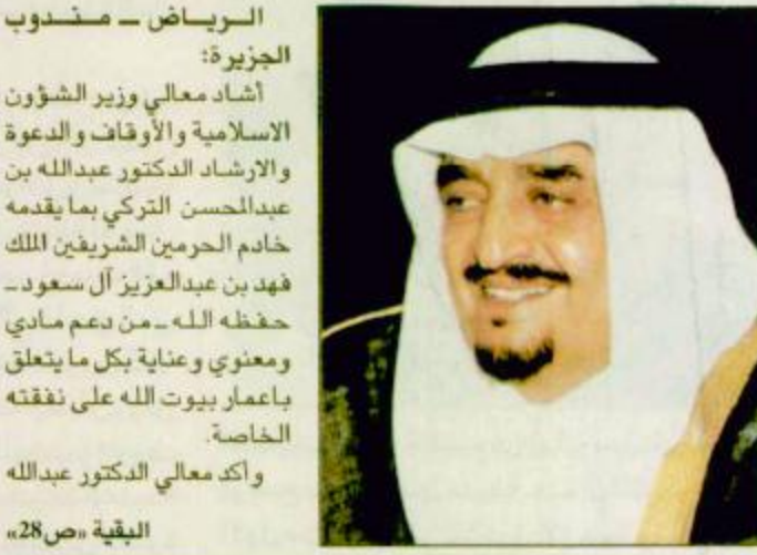
الرياض - مسندوب الجزيرة: أشاد معالي وزير الشؤون الإسلامية والأوقاف والدعوة والإرشاد الدكتور عبد الله بن عبدالحسن التركي بما يقدمه خادم الحرمين الشريفين الملك فهد بن عبدالعزيز آل سعود - حفظه الله - من دعم مادي ومعنوي وعناية بكل ما يتعلق بأعمار بيوت الله على نفقته الخاصة.

د. التركي: العمل جارٍ في ٣ جوامع بالشرقية بتكلفة ٦٦ مليون ريال أغلب مناطق المملكة اقيمت بها جوامع على نفقة خادم الحرمين