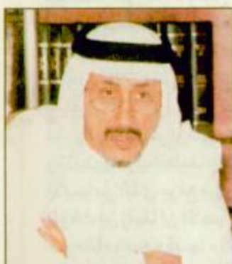
وزارة الزراعة تعلن أسماء المرشحين لمسابقة الوظيفة ص

تنظيم خاص لـ «دوام الطيبة السعودية» .. يعرض على مجلس الخدمة المدنية قريباً