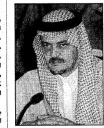
□ الأمير سعود الفيصل

المملكة.. وباكستان تأملان أن يكون لقرارات الأمم المتحدة دورها تجاه قضية كشمير لإيجاد حل سلمى أسامة بن لادن ليس سعودياً وسحبت منه الجنسية بناء على طلب أهله وذويه