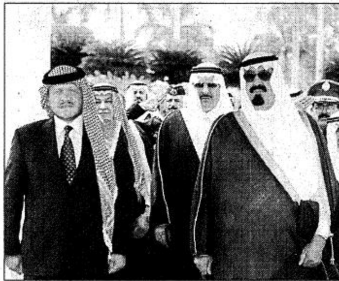
○ الأمير عبدالله وملك الأردن أثناء السلام الملكي للبديين ○