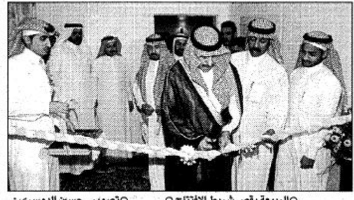
○ الربيعية يلصق شريط الافتتاح ○ تصوير-حسين الدوسري ○