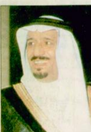
جنادرية ١١ ص 10

وجّه صاحب السمو الملكي الأمير سلمان بن عبدالعزيز أمير منطقة الرياض رئيس الهيئة العليا لجمع التبرعات لمسلمي البوسنة والهرسك والصومال تحية شكر وتقدير لكل من ساهم وشارك من المواطنين والمقيمين ورجال الأعمال والأدباء والكتّاب والشعراء ورجال الصحافة ووسائل الاعلام المختلفة في إنجاح فعاليات اسبوع البوسنة والهرسك الثالث للإغاثة والإعمار.