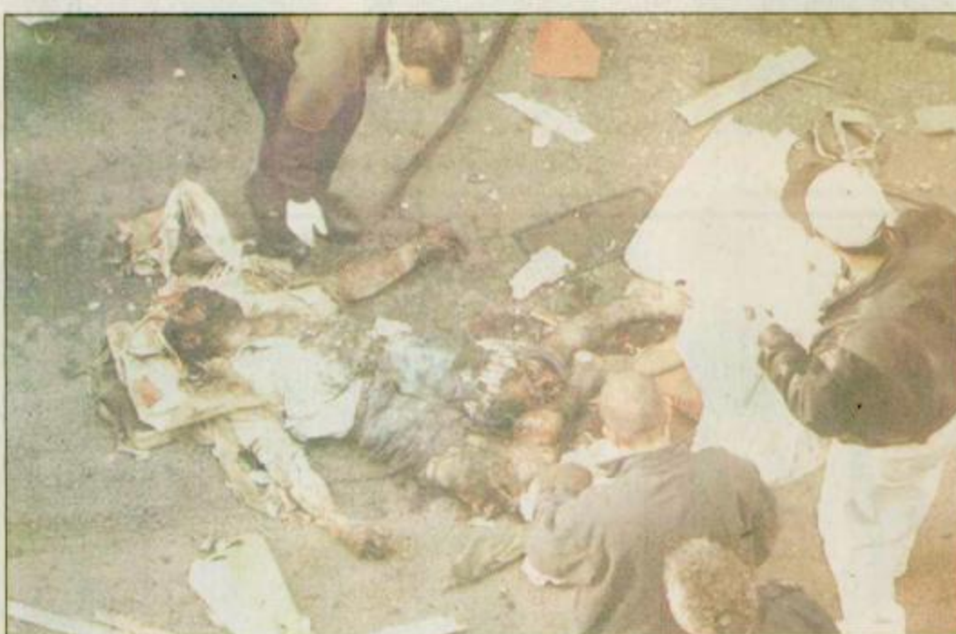
القدس : عمال الانقاذ يقفون بجانب أحد الضحايا بعد العملية الانتحارية التي قام بها أحد أفراد حركة حماس لتفجير حافلة مكتظة بالإسرائيليين في قلب مدينة القدس .

الرياض - عبدالرحمن المصبيح: اكتمالي وزير المعارف الدكتور محمد الأحمد الرشيد على ضرورة اكمال المدرسين نصابهم من الحصص في المدارس المحتاجة وأشار د. الرشيد في توجيه لجميع ادارات التعليم في المملكة إلى ضرورة اكمال المدرس نصابه من الحصص في مدرسته المعين بها ان أمكن ذلك وإلا يكلف باكمله في مدرسة أخرى في المنطقة دون النظر الى المسافة بين هاتين المدرستين على الا تصل هذه المسافة الى مسافة الانتداب... على أن يعامل المدرس الذي يكمل في مدرسة أخرى غير مدرسته من حيث عدد الحصص وفق الضوابط التي صدرت مؤخراً مع التنسيق بين المدرسين بحيث لا يعمل المدرس في المدرستين كلتيهما في يوم واحد، بل يعمل بعض ايام الأسبوع في مدرسة ويقية ايام الأسبوع في مدرسة أخرى إلا إذا كانت المدرستان متجاورتين وقريبتين من بعضهما البعض أو في مبنى مشترك.