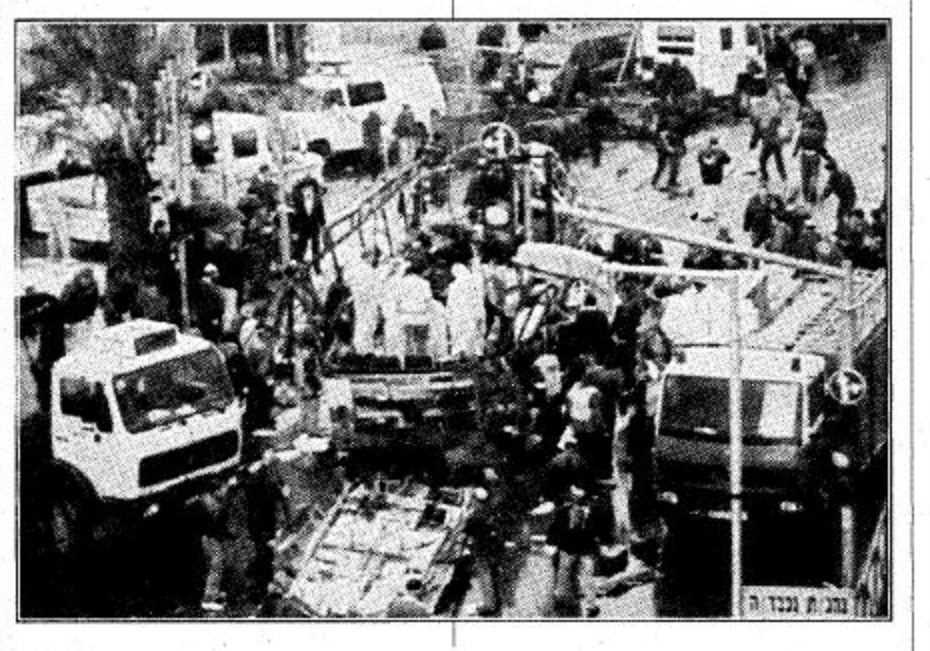
عمال الإقناض يفتشون وسط حمام الحافلة التي دمّرت بواسطة انفجار قنبلة في قلب الحي التجاري بالقدس

واضاف قوله «الخطأ كانت دخول «مستوطنة جديدة» وقتل أي شيء يمكن أن تصل إليه أيديهم». واعترض جنود اسرئيليون للمسلحين أمس الاول عندما طمّنت اقدامهم جرس انذار في سور الكتلوني للانذار بفصل بين بلدة خان يونس وبين منطقة قطيف للمستوطنات اليهودية في وسط قطاع غزة. وقال ايتان ان اثنين من افراد المجموعة تمكنوا من الهرب لكن الخمسة الآخرين استسلموا عندما حاصرم جنود اسرئيليون. ودعا الجيش الصحفيين إلى معبر ايريز حيث شاهدوا مجموعة من الاسلحة البيضاء وقنابل بزنين ونسخة من القرآن الكريم كانت بحوزة افراد المجموعة. وقال ايتان «توجد شرطة فلسطينية بيننا وبين خان يونس». في رأينا انه كان يمكن تلك الشرطة أن تبذل جهودا أكبر بكثير لمنع هذه المجموعة الكبيرة من التسلسل إلى منطقة المستوطنات.