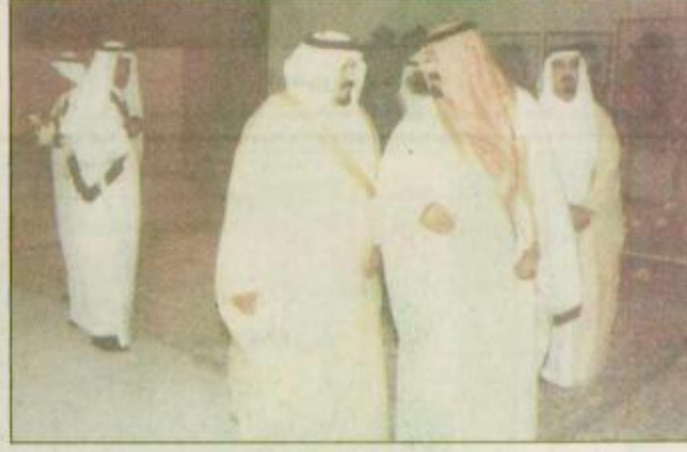
جدة - حفر الباطن - واس بحفظ الله ورعايته وصل صاحب السمو الملكي الامير عبداللله بن عبدالعزيز ولي العهد وتائب رئيس مجلس الوزراء ورئيس الحرس الوطني الى جدة بعد عصر أمس قادماً من حفر الباطن بعد زيارة تفقدية لها. وكان في استقبال سموه بمطار الملك عبدالعزيز الدولي صاحب السمو الملكي البقية ص 24