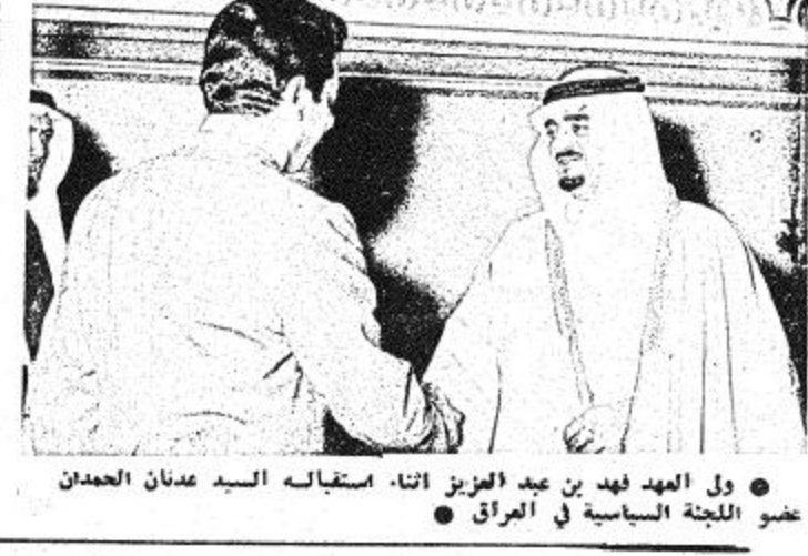
ول العهد فهد بن عبد العزيز اتنا استقباله السيد عدنان الحمدان عضو اللجنة السياسية في العراق