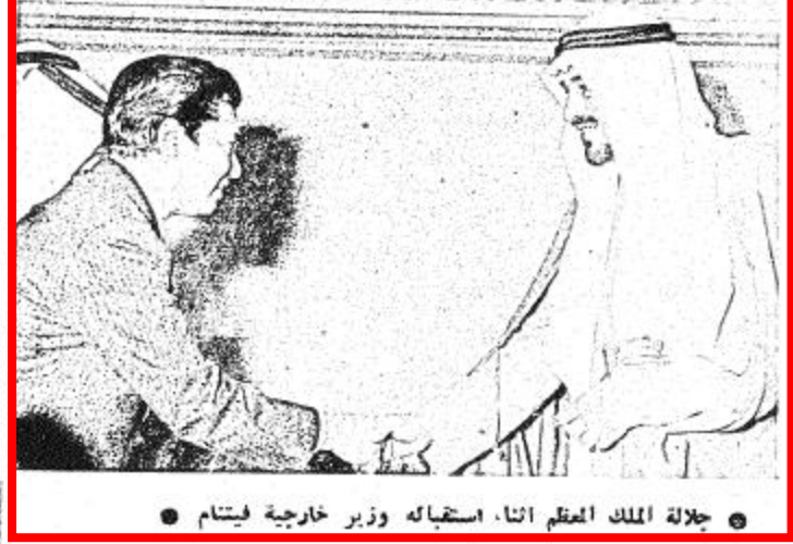
جلالة الملك المعظم اتنا استقباله وزير خارجية فيتنام