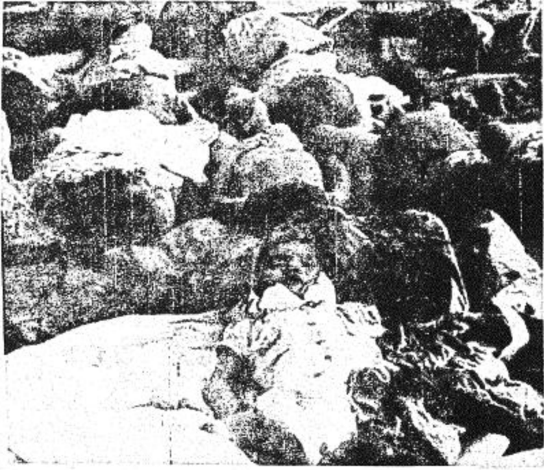
في تمام الجنوبية - نها ترانج ١١ أبريل ب.ب. لاسلكية - جئت الأطفال الذين ماتوا من التعب والحسرة واليافظ يرفلون في صفوف مترسعة احد الارصفة بانتظار طعامهم . ويذكر ان هؤلاء الاطفال قد ماتوا بينما كانوا ينتظرون اجلاهم على ظهر إحدى البواخر التي ليونج تاو خلال الايام الممطرة في دلتا المي . وقد جا. اليا. الى هذا الرسيف للبحث عن المفقودين بعد ان اتصلوا عنهم ولقد صعدوا رؤية هذا المنظر .

واعلم الجنرال ساك سوتشاكام في خطاب القاء مباشرة عقب تصويت المجلسين المنتخبين في جلسة طارئة . واعلم الجنرال ساك سوتشاكام في خطاب القاء مباشرة عقب تصويت المجلسين في جلسة طارئة . انشاء لجنة عليا لجمهورية كمبوديا تتكون من سبعة أعضاء .