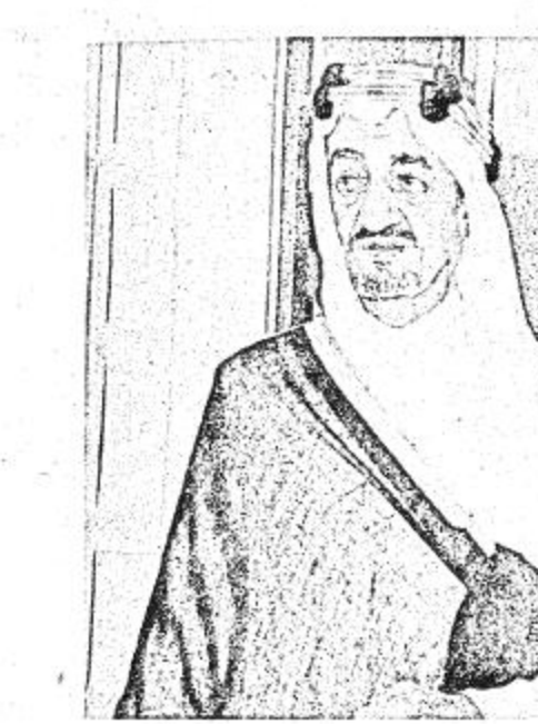
استقبالات الملك - بقية

وكان الرئيس فورد قد اوضح من قبل انه كان قد اذن بترحيل عدد من الكمبوديين الذين كانت حياتهم ستعرض للتهديد لو بقوا في بلادهم . اجلت اميركا رعاياها ممن بنوم بنه وسط حراسة مشددة لم تواجهها اي صعوبات