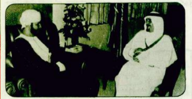
تلقى خادم الحرمين الشريفين الملك فهد بن عبدالعزيز آل سعود - حفظه الله - رسالة من جلالته السلطان قابوس

هنا الشيخ زايد خادم الحرمين الشريفين ينقل رسالة وزير الدفاع السعودي