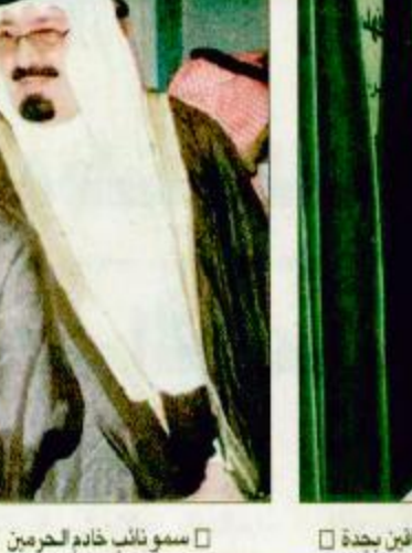
سمو نائب خادم الحرمين يزيح الستار عن لوحة التذكارية لمركز جمعية الأطفال المعاقين بجدة

الرياض جدة - نايف البشري، حسن الهيكلي، واصل يحفظ الله ووعيته صاحب السمو الملكي الأمير عبدالله بن عبدالعزيز نائب خادم الحرمين الشريفين ال الرياض بعد عصر امس قادما من جدة. وكان في استقبال سموه بمطار الرياض صاحب السمو الملكي الامير مشعل بن عبدالعزيز وصاحب السمو الامير فهد بن مشاري بن جلوي وصاحب السمو الامير محمد بن محمد بن عبدالعزيز بن ماجد بن عبدالعزيز وصاحب السمو الامير سلطان بن عبدالعزيز نائب امير منطقة الرياض واصحاب السمو الملكي الامراء ومعالي رئيس مجلس الشورى واصحاب العالي الوزراء. كما كان في استقبال نائب خادم الحرمين الشريفين معالي نائب رئيس الحرس الوطني المساعد الشيخ عبدالعزيز بن عبدالحسن التويجري وكلاء الحرس الوطني وكبار المسؤولين من مدنيين وعسكريين وجمع من المواطنين. وقد وصل في معية صاحب السمو الملكي الامير عبدالله بن عبدالعزيز صاحب السمو الملكي الامير فهد بن محمد بن عبدالعزيز الفصائل، البقية - ص ١٣، ص ١٤.