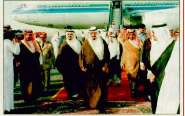
لقطات من وصول نائب خادم الحرمين الشريفين للرياض