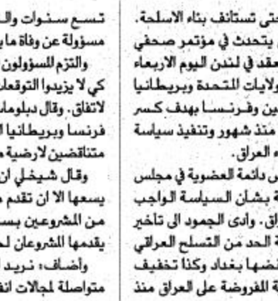
غراب الأشراف حتى ستانفورد بنه الأسلحة. وكان شيخلي يتحدث في مؤتمر صحفي قبيل اجتماع يعقد في لندن اليوم الأربعاء لممثلين من الولايات المتحدة وبريطانيا وروسيا والصين وكوسوفو بهدف كسر الجمود المستمر منذ شهر وتنفيد سياسة دولية موحدة أزاء العراق.

تسعى سناتور والتي يقول العراق لها مسؤولة عن وفاة ما يزيد على مليون شخص. والتزم المسؤولون البريطانيون جانب الحذر كي لا يسيءوا للعراق بل الممثلين سوياليين لاتفاق. وقال دبلوماسي أن احتمالات أن تصل فرنسا وبريطانيا للثلاث قمتها مشروعيه متناقضين لأرضية مشتركة لا تزيد عن 50٪. وقال شيخلي أن المعارضة العراقية لا يسعها إلا أن تقدم مواقفها الحذرة على أي من المشروعيه بسبب الحيرة التي تعاني منها. ويقدم عليه الحكومة العراقية وأضاف: نريد أن تكون هناك رقابة متواصلة لجلسات اتفاق صدام لأمواله.