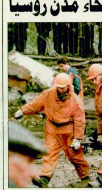
موسكو - روسيا (أ. ب. ف) عمل الأتقان يحملون جثمان أحد الضحايا بعد استرجاعه من وسط الحطام بالمنى السكني الذي انفجر بسبب انفجار قبيلة