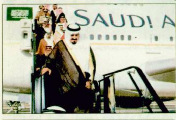
الأمير سلطان بن عبدالعزيز آل سعود في مطار الرياض، وهو يرافقه سمو النائب الثاني للأمير محمد بن عبد العزيز آل سعود.