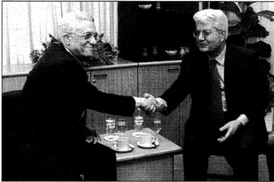
تفظة تفطيش بريتز (أ.ف.ب.) وزير الخارجية الإسرائيلي ديفيد ليفي (يمين) والمفاوض الفلسطيني محمود عباس نائب الرئيس عرفات يتصافحان عند نقطة تفطيش بريتز أيلانا بهذه المحادثات الخاصة باتفاق السلام الآخي.

شباط (فبراير) من عام الفين، على أن يتم التوصل إلى تسوية نهائية في 13 أيلول (سبتمبر) من العام نفسه. وهكذا أهداف وضعتها لانتفاضة وهي أن تنتهي المرحلة الأولى خلال وحول توقعات بعض المشاركين في المؤتمر قال رئيس روس البعوث الأمريكي لعملية السلام في الشرق الأوسط: «هذه المحادثات ستكون