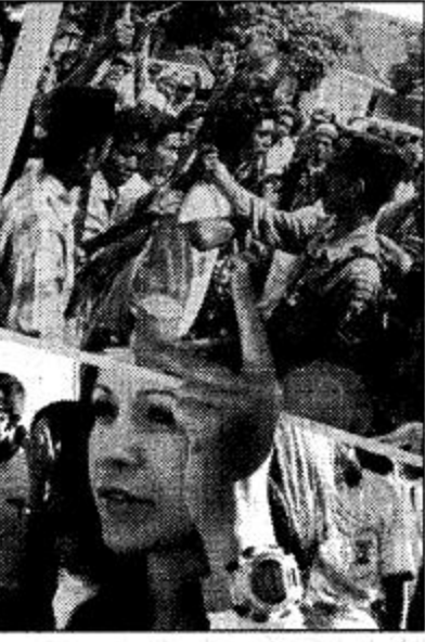
دليل جاكوتا. نيويورك الوكالات، اعلن وفد مجلس الأمن الدولي الذي زار تيمور الشرقية يوم الاثنين أن الحكومة الإندونيسية والقيادة العسكرية لم تكونا مدركتين كليا بمعنى اتساع أعمال العنف التي ارتكبتها الجبهة الانفصالية في هذه المستعمرة البرتغالية السابقة.

وقال مارتن «كان هناك قلق كبير من جانبنا على مستقبلهم ولا يمكن في الظروف الراهنة في تيمور الشرقية لتفادي ترتيبات أخرى لضمان سلامتهم». وكانت اليهيات قتلت ما يقدر بالآلاف الأشخاص في موجة من أعمال العنف استهدفت أمام تصويت من أجل الاستقلال من اندونيسيا في 30 أغسطس الماضي، وناقش مجلس الأمن حاليا تشكيل وتوقيع إرسال قوة دولية لحفظ السلام من التوقع أن تصل إلى تيمور الشرقية خلال أيام. وإعلان وزير الخارجية الكندي لود كسوروثي في مؤتمر صحافي عبر الأقمار الاصطناعية من جزر فيجي، أن المسؤولين عن «القطاعات» التي ارتكبت في تيمور الشرقية يجب أن يفعلوا للمحاكمة. وعبر كسوروثي عن أمله في إخراج هذا «البلاء» في القرار الذي يفترض أن يتعمده مجلس الأمن الدولي من أجل إرسال قوة دولية إلى تيمور الشرقية. وقال «نعتقد أنه يجب بذل جهد في القرار لنبدأ بمحاسبة الأشخاص المسؤولين عن القطاعات». وأضاف أنه يمكن محاكمة اللذين التحملين أمام محكمة دولية تشكل لهذه الغاية، كما طالبت للفضة العليا لحقوق الإنسان ماري روبنسون، و أمام المحكمة التي تشكلت أصلا من أجل زولنا وكوسوفو والتي «يمكن توسيع صلاحيتها» ووضع «معايير عالية» من لهم جندا يروح إليها في القرار. وعبر كسوروثي في وصل إلى فيجي فلندا من أوكلاند في نيوزيلندا حيث شارك في قمة منتدى التعاون الاقتصادي لدول آسيا والمحيط الهادئ.