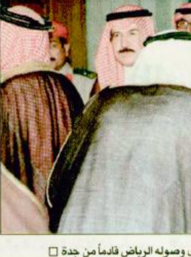
سمو نائب خادم الحرمين لدى وصوله الرياض قادما من جدة