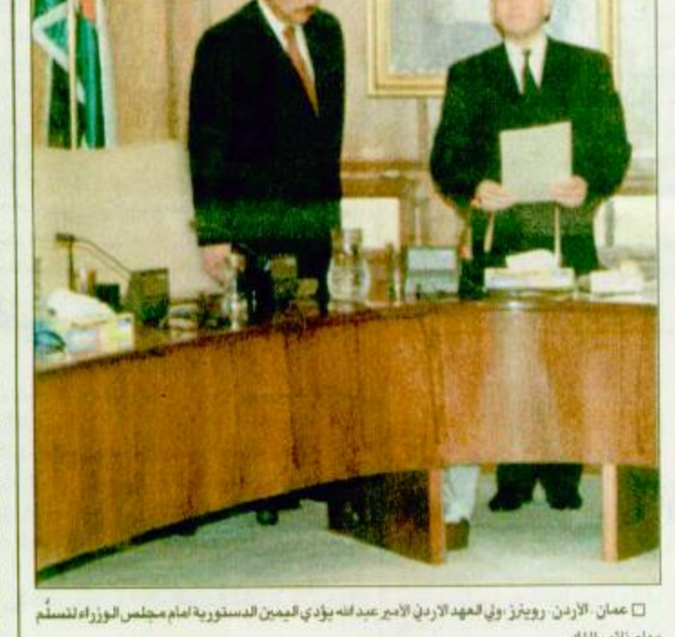
□ عمان - الأردن، ووفد ولي العهد الأردني الأمير عبد الله يؤدي تهنيتي الدستورية أمام مجلس الوزراء لتسليم مهام نائب الملك.