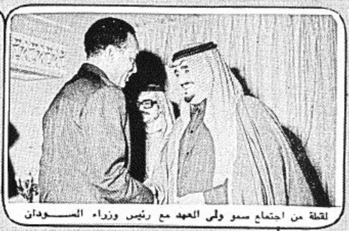
لقطة من اجتماع سمو ولي العهد مع رئيس وزراء السودان