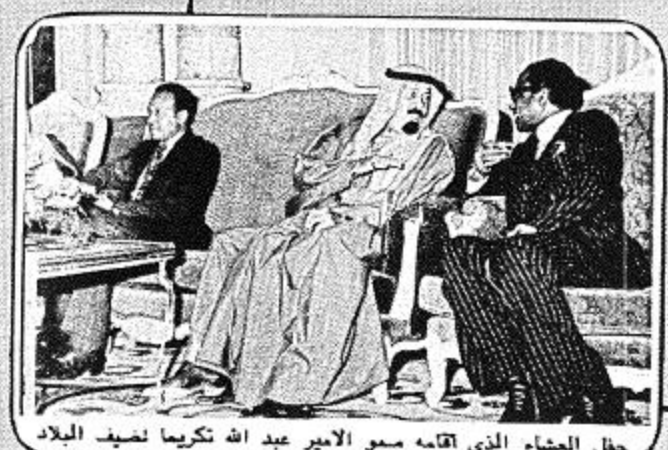
حلل الشاه الذي اقامه سمو الامير عبد الله تكريماً لضيوف البلاد