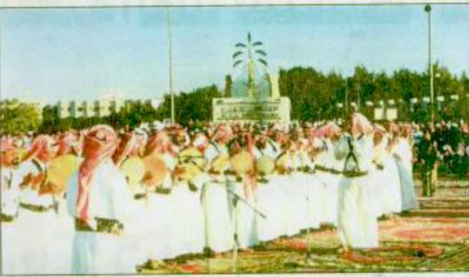
الفتون الشعبية الخاصة يقابل الطائف حاضرة في كل المناسبات

عهد الأمين هذه المنطقة أهمية كبيرة كغيرها من مناطق المملكة فهي الصيف الأول وأسهمت كغيرها في النهضة الشاملة الحديثة التي تشهدها هذه البلاد ولا يبالغ لنا في أن «الطائف» وكافة محافظات وقري وهجر للملكة تعيش أزهى عصورها في عهد حكومتنا الرشيدة ففي كل يوم تشهد مولد إنجاز جديد وثقافة المحمد على ذلك والشطلع للأرض والأحوال من حوله يجد أن المشاريع والإنجازات التي تنفذ وتقام على أرض وطننا العلي ما هي بعد فضل الله سبحانه وتعالى إلا ثمره المعروف فإن محافظة الطائف كغيرها من المحافظات المرتبطة بإمارة منطقة مكة المكرمة تحظى بالاهتمام والحرس والتابعة من قبل صاحب السمو الملكي الأمير ماجد بن عبدالعزيز أمير منطقة مكة المكرمة الذي حرص ويتابع شخصياً توفير جميع الخدمات المشيئة مكة المكرمة عملة والطائف خاصة قال سموه ليس غريباً أن يعطي مولاي خادم الحرمين الشريفين - رعاه الله - وسمو ولي مملكتنا العلية. أهمية كبيرة وحول اهتمام حكومة الملكة بشئون منطقة فهد بن عبدالعزيز - يحفظه الله - الذي يحرص دوماً على راحة المواطنين في كافة مناطق المملكة. النهج القويم ثم أضاف سموه قائلاً: وتأتي الزيارة اليمونة لصاحب السمو الملكي الأمير عبدالله بن عبدالعزيز لمحافظة الطائف استمراً للنهج القويم الذي تسير عليه قيادة هذا الوطن العالي في رعاية شئون المواطن وتنفذ مختلف الجوانب لسيرة الخير والتماء، ولم يكن غريباً ذلك الشعور الفياض بالمساعدة والفرح الذي غمر أهالي وإبناء محافظة الطائف عند مقدم سموه الكريم وتواجده بينهم فهم يسعدون به وبإخلاصه للوطن ولأبنائه وحرصه على أن يتعمق كل فرد منهم بكل أسباب الخير والأمن والتماء الذي يعيشه كل مواطن في