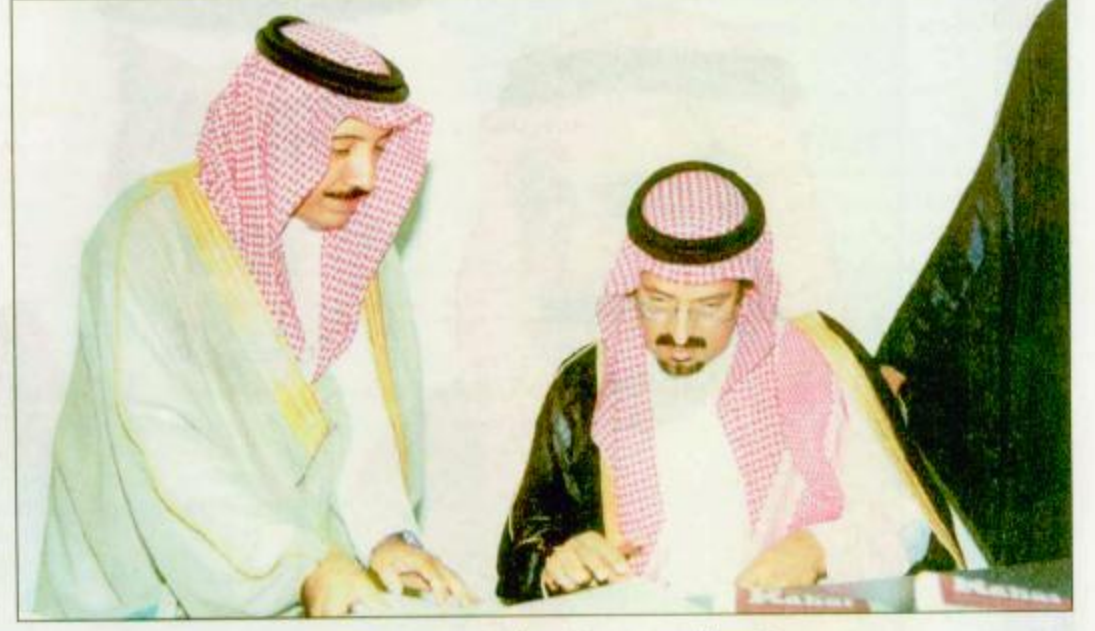
سمو الأمير سعود بن عبدالمحسن أثناء الحديث للزميل السالمي

لمواطني المحافظات والراكز المرتبطة بإمارة المنطقة وقد حظيت محافظة الطائف كغيرها من محافظات ومراكز المنطقة بالعديد من المشاريع التنموية المختلفة لخدمة المواطنين التي تأتي تمشياً مع إستراتيجية للتنمية الشاملة التي ترعاها الدولة في كافة المجالات. التحرك الدولي أيضاً وتتلقى سمو الأمير سعود في حديثه لنا إلى ما يقوم به سمو الأمير عبدالله من جولات وزارات لم تقتصر على الداخل وإنما شملت الخارج أيضاً، فقال: إن ما يقوم به صاحب السمو الملكي الأمير عبدالله بن عبدالعزيز - ولي العهد ونائب الملك فهد بن عبدالعزيز - رعاه الله - وصاحب السمو الملكي الأمير عبدالله بن عبدالعزيز ولي العهد ونائب رئيس مجلس الوزراء ورئيس مجلس الأمن والسلم الدوليين من جولات وزارات لم تقتصر على الداخل وإنما شملت الخارج أيضاً، فقال: إن ما يقوم به صاحب السمو الملكي الأمير عبدالله بن عبدالعزيز - ولي العهد ونائب رئيس مجلس الأمن والسلم الدوليين من جولات وزارات لم تقتصر على الداخل وإنما شملت الخارج أيضاً، فقال: إن ما يقوم به صاحب السمو الملكي الأمير عبدالله بن عبدالعزيز - ولي العهد ونائب رئيس مجلس الأمن والسلم الدوليين من جولات وزارات لم تقتصر على الداخل وإنما شملت الخارج أيضاً، فقال: