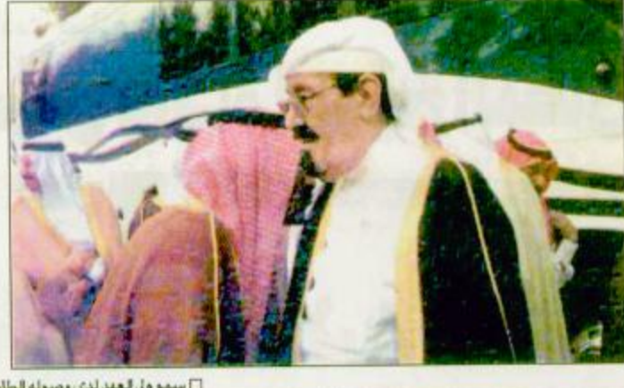
سمو ولي العهد لدى مغادرته جدة