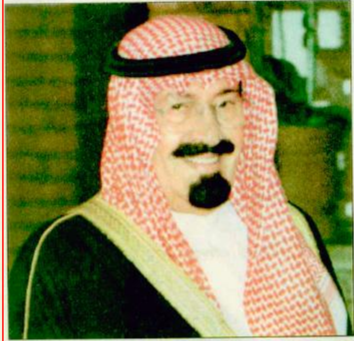
سعادة وفرح أهالي الطائف مصدرهما اخلاص سمو ولي العهد للوطن وللمواطنين

التحرك الدولي لسمو ولي العهد هو دفاع عن عقيدتنا ولم الشمل العربي والإسلامي وزرع الثقة في القلوب الطائف تعيش أزهى عصورها.. وأسهمت في نهضة وتطور البلاد