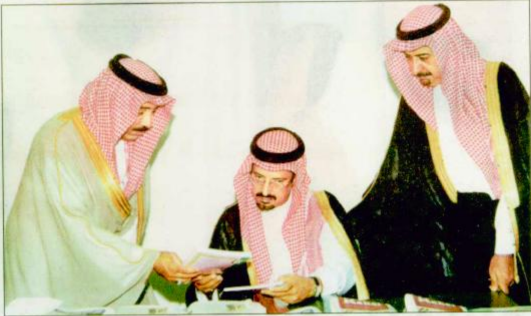
سمو الأمير سعود بن عبدالمحسن في افتتاحه معرض الكتاب بالطائف وإلى جانبه يساراً معالي محافظ الطائف ومدير المعرض حماد السالمي