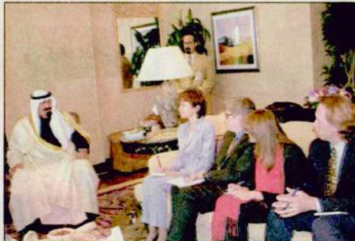
□ بيروت - دمشق - الدار البيضاء - واس: أكد صاحب السمو الملكي الأمير عبدالله بن عبدالعزيز ولي العهد نائب رئيس مجلس الوزراء رئيس الحرس الوطني أن المملكة العربية السعودية لم تدخر أي جهد ولم تبخل بأي دعم للقضية الفلسطينية ومنذ ستين عاماً وهي تسعى لإفهام أمريكا بعدالة القضية الفلسطينية ودفعها لاتخاذ موقف عادل متوازن.

□ جدة - واس: استقبل خادم الحرمين الشريفين الملك فهد بن عبدالعزيز آل سعود في قصر السلام أمس السيدة وو بي عضو مجلس الدولة نائبه رئيس مجلس الوزراء بجمهورية الصين الشعبية المسؤولة الاقتصادية والتجارة الخارجية.