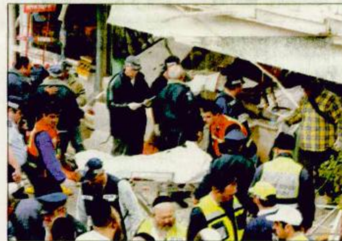
استخراج إحدى الجثث من جراء العملية الاستشهادية

وصرح رئيس جهاز الأمن الوقائي الفلسطيني العقيد جبريل الرجوب لووكالة فرانس برس أن الاسرائيليين اعدموا في المساء ثلاثين فلسطينياً داخل مبني في وسط رام الله واعتبر انه اغتيال جماعي.