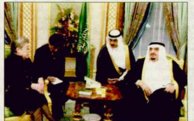
خادم الحرمين يستقبل عضو المجلس نائبه مجلس الوزراء الصيني - واس

القيادة تعزي الملكة اليزابيث خادم الحرمين استقبل نائبه رئيس مجلس الوزراء الصيني