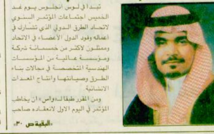
تبدأ في الرياض اجلسات المؤتمر السنوي لاتحاد الطرق الدولي الذي تتشارك في اعضائه وفود الدول الأعضاء في الاتحاد ويمثلون لأكثر من خمسمائة شركة ومؤسسة عالمية من المؤسسات الهندسية المتخصصة في مجالات بناء الطرق وصيانتها وانشاء المعدات الانشائية ومن المقرر طبقا لـ «واس» ان يخاطب المؤتمر في اليوم الاول لاتعاظه صاحب