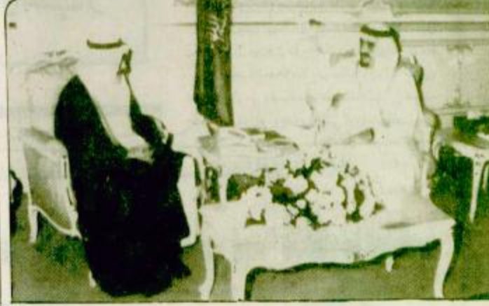
تسلم خادم الحرمين الشريفين الملك فهد بن عبد العزيز آل سعود - حفظه الله - رسالة من صاحب السمو الفيحان