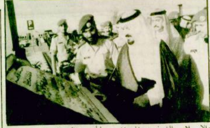
وادي الدواسر : مبارك الفاضل / واس

الأمير سلطان رعى تخريج دورات في مركز ومدرسة قوة الصواريخ الاستراتيجية