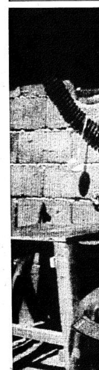
ترفيشش - البوسنة أب أحد الجنود الصرب يلتزم فرصة سريان وقف إطلاق النار ليقوم بتخليص بندينه الكشاكوش بأحد نقاط التفتيش بجبل ترفيشش بالقرب من سراييفو يوم الأحد الماضي.

علم من مصدر أمريكي أن أول دبلوماسي أمريكي إلى فيتنام منذ عام ١٩٧٥ سيوصل إلى هانوي اليوم الأربعاء في مهمة مؤقتة تتعلق بتسوية قضية الجنود الأمريكيين المفقودين في الهند الصينية التي تعتبر أكبر العوائق في وجه تطبيع العلاقات بين البلدين.