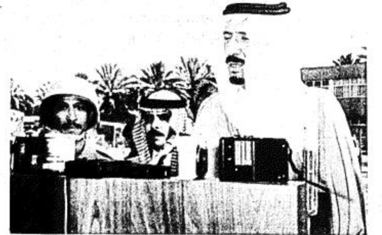
تغطية / عبدالله محمد الحواس

أكد صاحب السمو الملكي الأمير سلمان بن عبدالعزيز أمير منطقة الرياض أن الدفاع عن الوطن واجب محمّد علينا جميعاً. وأضاف سموه بقوله في حفل تخريج الدفعة الأولى من المتطوعين بمنطقة الرياض والذي أقيم في كلية الملك عبدالعزيز الحربية سابقاً. أن هذا اليوم الذي تم فيه تخريج المتطوعين في سبيل الله ثم في سبيل الوطن هو يوم فرح لهم وللوطن وهو اليوم الذي أكمل فيه المتطوعون التدريبات وبدأوا الخطوة الأولى لخدمة الدين والوطن. وأضاف سموه أنكم تمثلون الطليعة اليوم لاختونكم المتطوعين في الرياض وفي جميع أنحاء المملكة. ورحب سموه في المتطوعين هذا الموقف وهذه الروح الإسلامية روح الجهاد والفداء في سبيل الله ثم في سبيل هذا