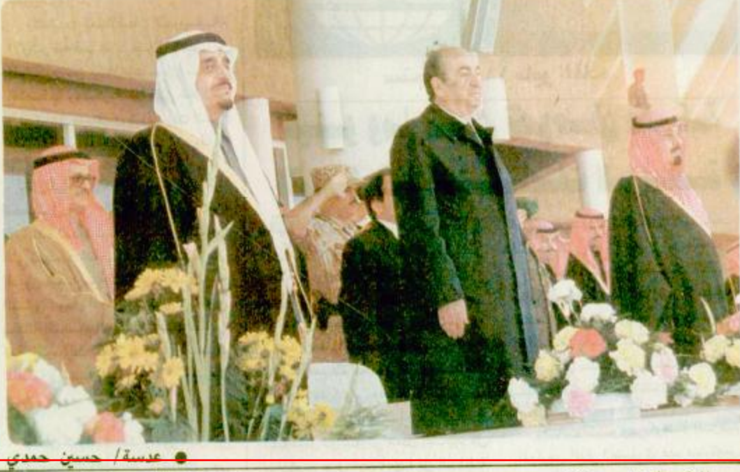
عبدالله بن عبدالعزيز آل سعود مع ولي عهد البحرين وولي عهد الامارات

الجنادرية - بعة الجزيرة رضى خادم الحرمين الشريفين الملك فهد بن عبد العزيز آل سعود صباح امس حفل افتتاح المهرجان الوطني السابع للتراث والثقافة بالجنادرية وكان - حفظه الله - قد وصل الى مقر المهرجان في الساعة الحادية عشرة وخمس واربعين دقيقة وكان في استقباله صاحب السمو الملكي الامير عبد الله بن عبد العزيز ولي العهد ونائب رئيس مجلس الوزراء ورئيس الحرس الوطني وصاحب السمو الملكي الامير مشعل بن عبد العزيز وولي العهد ونائب رئيس مجلس الوزراء ورئيس الحرس الوطني وصاحب السمو الملكي الامير سلطان بن عبد العزيز وقد وصل في معية حفظه الله صاحب السمو الملكي الامير سلطان بن عبد العزيز امير منطقة الرياض وفور وصول خادم الحرمين الشريفين عزف السلام الملكي ثم اخذ حفظه الله مكانه في المقعد الرئيسية للحفل حيث بدأ الشوط الاول لسباق الفحص الشامن عشر الذي حضره صاحب السمو الشيخ حمد بن عيسى آل خليفة وولي العهد رئيس الوزراء بالنيابة القائد العام لقوة الدفاع بدولة البحرين الشقيقة ودولة رئيس وزراء اليونان قسطنطين ميتسو تاكيس الملكة ص 22 (تفاصيل بالداخل)