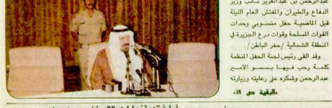
نائب وزير الدفاع يعرض حفل القوات المسلحة وقوات درع الجزيرة ببحر الماطن.

رعى صاحب السمو الملكي الأمير عبد الرحمن بن عبدالعزيز نائب وزير الدفاع والطيران والمفتش العام الليلة قبل الماضية حفل منسوبي وحدات القوات المسلحة وقوات درع الجزيرة في المنطقة الشمالية/ بحر الماطن. وقد ألقى رئيس لجنة الحفل المنظمة كلمة رحب فيها بسمو الأمير عبد الرحمن وشكره على رعايته وزيارته «القبعة ص ١٨»