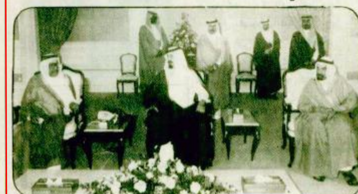
وصول سمو ولي العهد فيصل بن عبد الله بن عبدالعزيز آل سعود إلى الرياض لاستقبال جموعاً من المواطنين.

وصل بحفظ الله ورعايته صاحب السمو الملكي الأمير عبد الله بن عبدالعزيز ولي العهد ونائب رئيس مجلس الوزراء ورئيس الحرس الوطني الى جدة الساعة الواحدة والرابع من بعد ظهر امس. وكان في وداعه بسطار الملك عبدالعزيز الدولي طيفاً لـ «واس» صاحب السمو الملكي الأمير فيصل بن سعد بن عبدالعزيز الرئيس العام لإدارة الشباب ورئيس اللجنة الأولمبية السعودية. «القبعة ص ١٨»