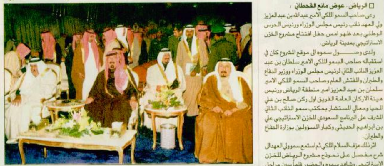
□ سمو ولي العهد لدى رعايته افتتاح مشروع الخزن الاستراتيجي □ وس، □

□ الرياض - عوض مانع القحطاني / رعى صاحب السمو الملكي الأمير عبدالله بن عبدالعزيز ولي العهد نائب رئيس مجلس الوزراء ورئيس الحرس الوطني بعد ظهر أمس حفل افتتاح مشروع الخزن الاستراتيجي بمدينة الرياض. □ وس، □