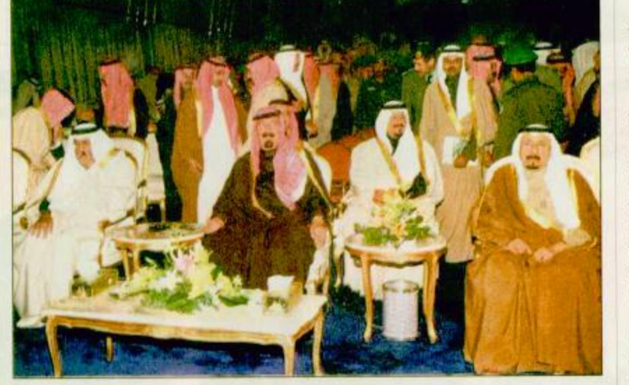
□ سمو ولي العهد لدى رعايته افتتاح مشروع الخزن الاستراتيجي □ واس □ سمو ولي العهد لدى رعايته افتتاح مشروع الخزن الاستراتيجي □ واس □ سمو ولي العهد لدى رعايته افتتاح مشروع الخزن الاستراتيجي □ واس

الأمير سلطان لـ «الجزيرة»: ١١ مليار ريال تكلفه مشروعات الخزن الخمسة وندرس استراتيجيات الخزن الغذائي والدوائي