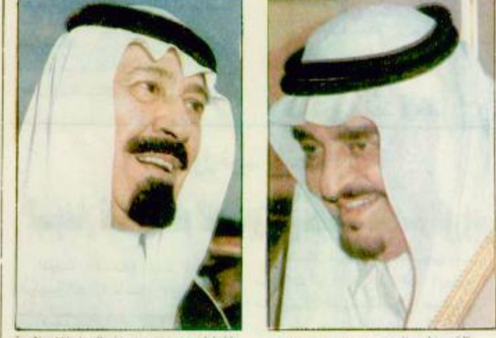
التقى خادم الحرمين الشريفين الملك فهد بن عبد العزيز - يحفظه الله - بمزيداً من برقيات التهاني بحلول عيد الفطر