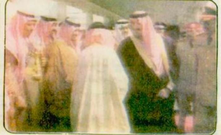
وصل صاحب السمو الملكي الأمير سلطان بن عبد العزيز النائب الثاني لرئيس مجلس الوزراء وزير الدفاع والطيران والمفتش العام ظهر أمس الى منطقة الجوف في زيارة للمنطقة وذلك