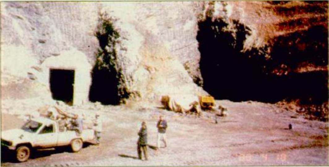
جلال اباد - أفغانستان - 1. ف. ب. صورة للكوف التي يعتقد ان بن لادن مخبئ فيها

سقط المزيد من القتلى في أفغانستان بعد أن صعقت أمريكا من حربها ضد طالبان وتنظيم القاعدة بإشراكها المروحيات وطائرات أخرى متطورة في الهجمات لأول مرة. ويأتي التصعيد الحربي هذا مع تحرك دبلوماسي وسياسي نشط لإقامة نظام بديل في أفغانستان أوكل للأمم المتحدة من خلال سوفيها الأخضر الابراهيمي الذي بدأ مشاورات مع أعضاء مجلس الأمن الدولي يساعده في ذلك الممثل الشخصي للأمن العام فرانسيسكو فانديريل. وفي إسلام آباد اتفق الرئيس الباكستاني برويز مشرف وكولن باول وزير الخارجية الأمريكي أمس الثلاثاء على أن تضم أي حكومة مستقبلية في أفغانستان المعارضة وحركة طالبان على السواء. وقال مشرف بعد اجتماعه مع باول «الملك الأفغاني» السابق ظاهر شاه والقادة السياسيون وقيادة طالبان المعتدلون وعناصر من تحالف الشمال (المعارض) وزعماء القبائل وأفغان يعيشون خارج البلاد.» البقية ص 33