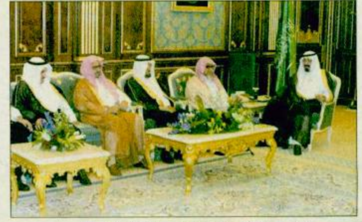
الأمير عبد الله لدى استقباله رئيس وأعضاء مجلس الشورى

أكد صاحب السمو الملكي الأمير عبدالله بن عبدالعزيز ولي العهد ونائب رئيس مجلس الوزراء ورئيس الحرس الوطني أن المملكة كانت وما زالت تعمل بكل جهد للدفاع عن مكانة الإسلام والمسلمين في كافة المحافل الدولية وتمتد يد العون والمساعدة للمحتاجين منهم كما أنها لم تبخل في يوم من الأيام بما تستطيع على المستوى السياسي أو المادي أو المعنوي للدفاع عن حقوقهم. البقية ص 33