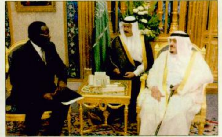
خادم الحرمين الشريفين لدى استقباله وزير خارجية كينيا

تسلم خادم الحرمين الشريفين الملك فهد بن عبدالعزيز آل سعود رسالة من فخامة الرئيس الكيني دانيال اراب موي. وقام بتسليم الرسالة لخادم الحرمين الشريفين معالي وزير خارجية كينيا كرسفور ابوري خلال استقبال الملك الفدي له بمكتبه في قصر اليمامة أمس. كما نقل معاليه لخادم الحرمين الشريفين تحيات وتقدير فخامة الرئيس الكيني وحضر الاستقبال البقية ص 33