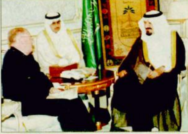
الأمير سلطان لدى استقباله رئيس بعثة التدريب العسكرية الأمريكية

استقبل صاحب السمو الملكي الأمير سلطان بن عبدالعزيز النائب الثاني لرئيس مجلس الوزراء وزير الدفاع والطيران والمفتش العام في مكتب سموه بالمعسكر أمس رئيس بعثة التدريب العسكرية الأمريكية اللواء سايلاس جونسون والوفد المرافق له الذي ودع سموه بمناسبة انتهاء فترة عمله بالمملكة.