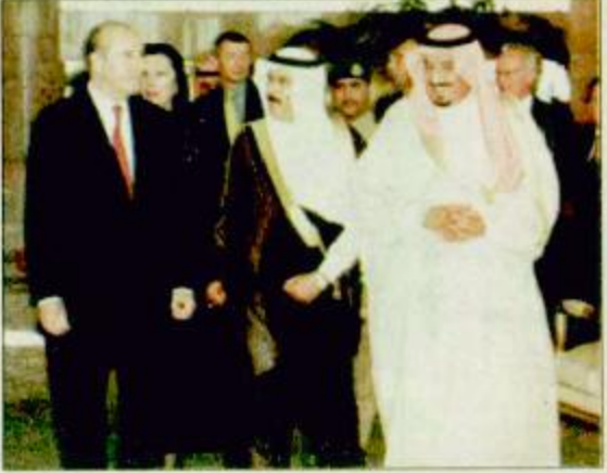
الأمير سلمان يودع الرئيس النمساوي

غادر فخامة الرئيس الدكتور توماس كلستيل الرئيس الاتحادي لجمهورية النمسا والوفد المرافق لفخامته أمس الرياض متوجهاً إلى جدة وكان في وداع فخامته بمطار الملك خالد الدولي بالرياض صاحب السمو الملكي الأمير سلمان بن عبدالعزيز أمير منطقة الرياض وصاحب السمو الأمير الدكتور عبدالعزيز بن محمد بن عياف آل مقرن أمين مدينة الرياض ومعالي وزير الدولة