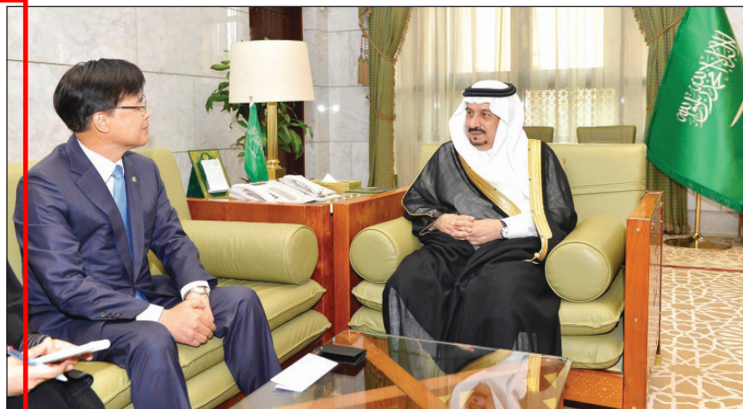
الأمير فيصل بن بندر مستقبلاً السفير كوري بيونج

الطبية في الشؤون الصحية بالحرس الوطني الدكتور سعد