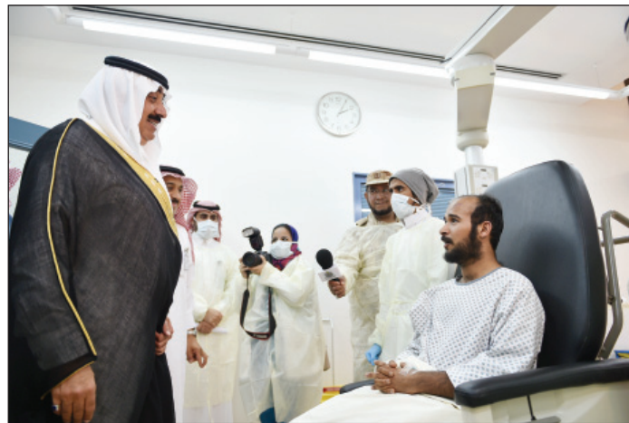
الأمير متعب بن عبدالله مطمئناً على صحة أحد منسوبي (الحرس الوطني)