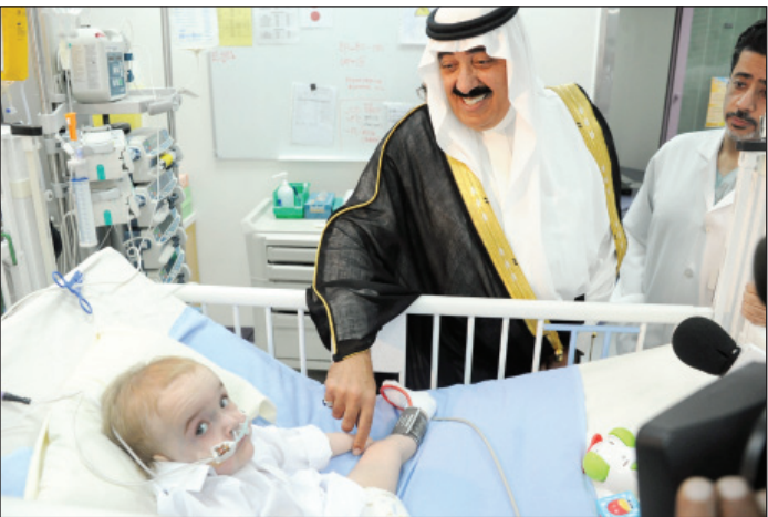
سموه أثناء زيارة الطفل البولندي