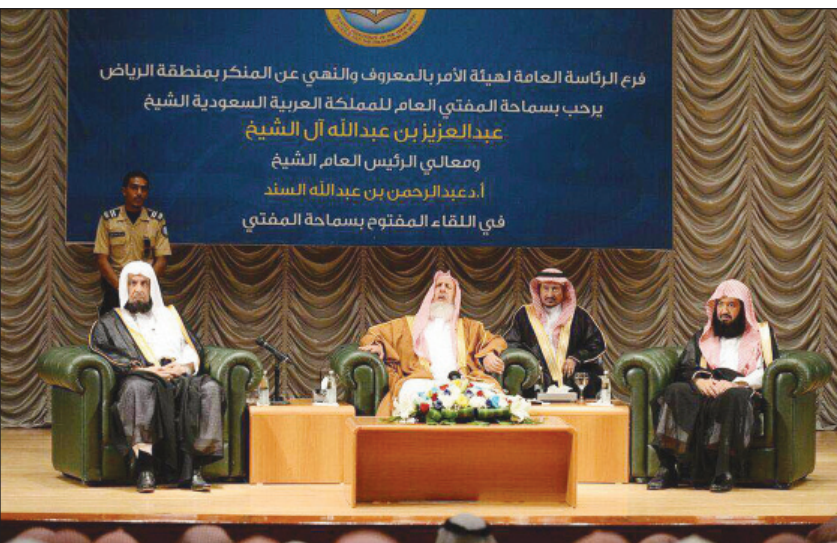
مفتي الملكة خلال اللقاء

الرياض - سعدون العويمري حث مفتي عام المملكة رئيس هيئة كبار العلماء وإدارة البحوث العلمية والإفتاء الشيخ عبدالعزيز بن عبدالله آل الشيخ، أمس الأول، أعضاء ومنسوبي الرئاسة العامة لهيئة الأمر بالمعروف والنهي عن المنكر على التحلي بالصبر واحتساب الأجر في القيام بشعيرة الأمر بالمعروف والنهي عن المنكر.