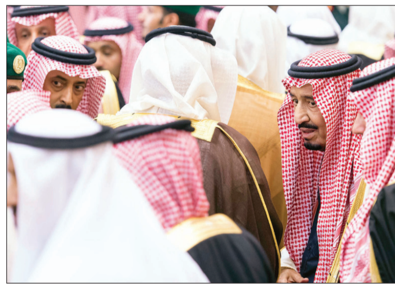
البيعة للملك ولولي العهد ولولي ولي العهد أظهرت للعالم أجمع متانة البيت السعودي

السعودي. من جانب آخر أكد الشيخ محمد البيشي إن المحاولات البائسة من قبل الحاقدين على المملكة وشعبها... خابت آمالهم، فمشهد البيعة الذي خرج إلى عالم عبر قنوات التلفاز أو مواقع التواصل الاجتماعي دليل على استقرار هذا البلد وتمسك الشعب بالقيادة مشيراً إلى أن البيعة تمثل حدثاً عظيماً في تاريخ المملكة دينياً وحضارياً، وتعبّر عن وعي وثقافة المواطن وتمسكه بالشرعية الإسلامية. وأضاف الشيخ البيشي أن ما شاهده العالم عند مبايعة ولاة أمرنا بعد وفاة الملك عبدالله بن عبدالعزيز -رحمه الله- شل أيادي الحاقدين، ولم تكن البيعة في الخفاء وإنما كانت علانية وعلى مدى العالم فالمواطنون من حضر وبايع ومنهم من بايع الحاكم الإداري في مناطق المملكة ومنهم من استخدم وسائل التواصل الاجتماعي لمبايعة خادم الحرمين الشريفين سمو ولي عهد وسمو ولي ولي العهد... وأضاف أن الشعب السعودي أماله مشرقة دائماً مع ولاة أمره وفقته بالله ثم بهم، والقيادة تبادلهم تلك الثقة وحريصة كل الحرص على رفاهيتهم وإن دل ذلك فإنما يدل على ما وصلت إليه المملكة عالمية في شتى المجالات السياسية والاقتصادية، وأصبح المواطن السعودي يشار إليه بالبنان في المحافل الدولية.