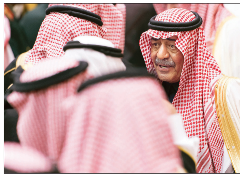
ولي العهد يتلقى مبايعة المواطنين