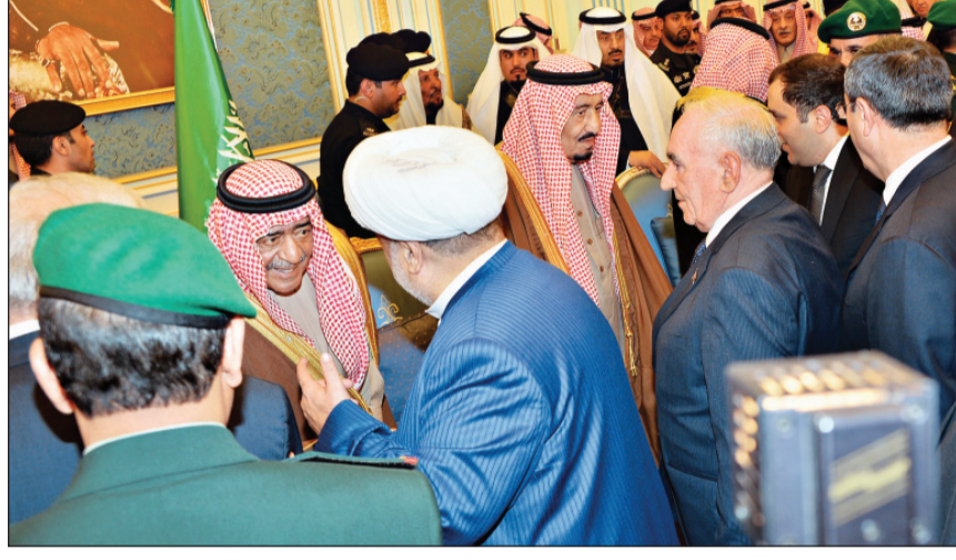
خادم الحرمين وسعودي ولي العهد يتلقيان التعازي في الملك عبدالله -رحمه الله-

الرياض - فريق المتابعة، واس تحولت الرياض أمس إلى "عاصمة العالم"، حيث توافد العديد من القادة وكبار المسؤولين من مختلف بقاع الأرض لتقديم واجب العزاء برحيل فقيد الأمة الكبير الملك عبدالله بن عبدالعزيز -رحمه الله- إلى خادم الحرمين الشريفين الملك سلمان بن عبدالعزيز وولي العهد ولأسرة الحاكمة والشعب السعودي، فيما تدفقت جموع الشعب على قصر اليمامة بالرياض مساء أمس في مشهد ملحمي لتقديم واجب العزاء. كما تلقى الملك سلمان بن عبدالعزيز -حفظه الله- اتصالات هاتفية أمس من فخامة الرئيس باراك أوباما رئيس الولايات المتحدة الأمريكية، ومن جلالة الملك محمد السادس ملك المملكة المغربية ومن جلالة الملك خوان كارلوس ملك مملكة إسبانيا السابق، قدموا خلالها التعازي في وفاة الملك عبدالله بن عبدالعزيز آل سعود -رحمه الله- وهنأوا الملك المفدى بتوليه مقاليد الحكم في المملكة. وأعلن البيت الأبيض أن الرئيس باراك أوباما سيتوجه بعد غد الثلاثاء إلى الرياض لتقديم تعازيه في وفاة الملك عبدالله مختصرا بذلك زيارته للهند التي يصلها اليوم الأحد. وكان الرئيس الأمريكي من أول المشيدين بالملك عبدالله ووصفه بالرجل "الصادق" و"الشجاع". (تغطية شاملة: داخل العدد)