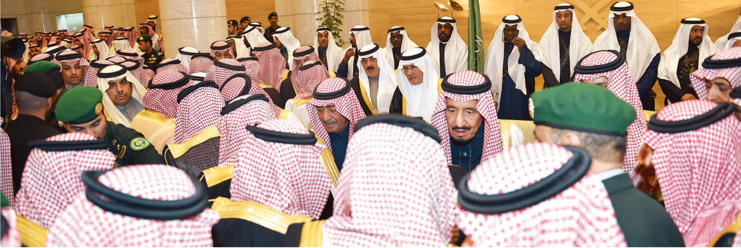
الملك سلمان والأمير مقرن يتلقيان البيعة من الأمراء والعلماء والمسؤولين وجموع المواطنين