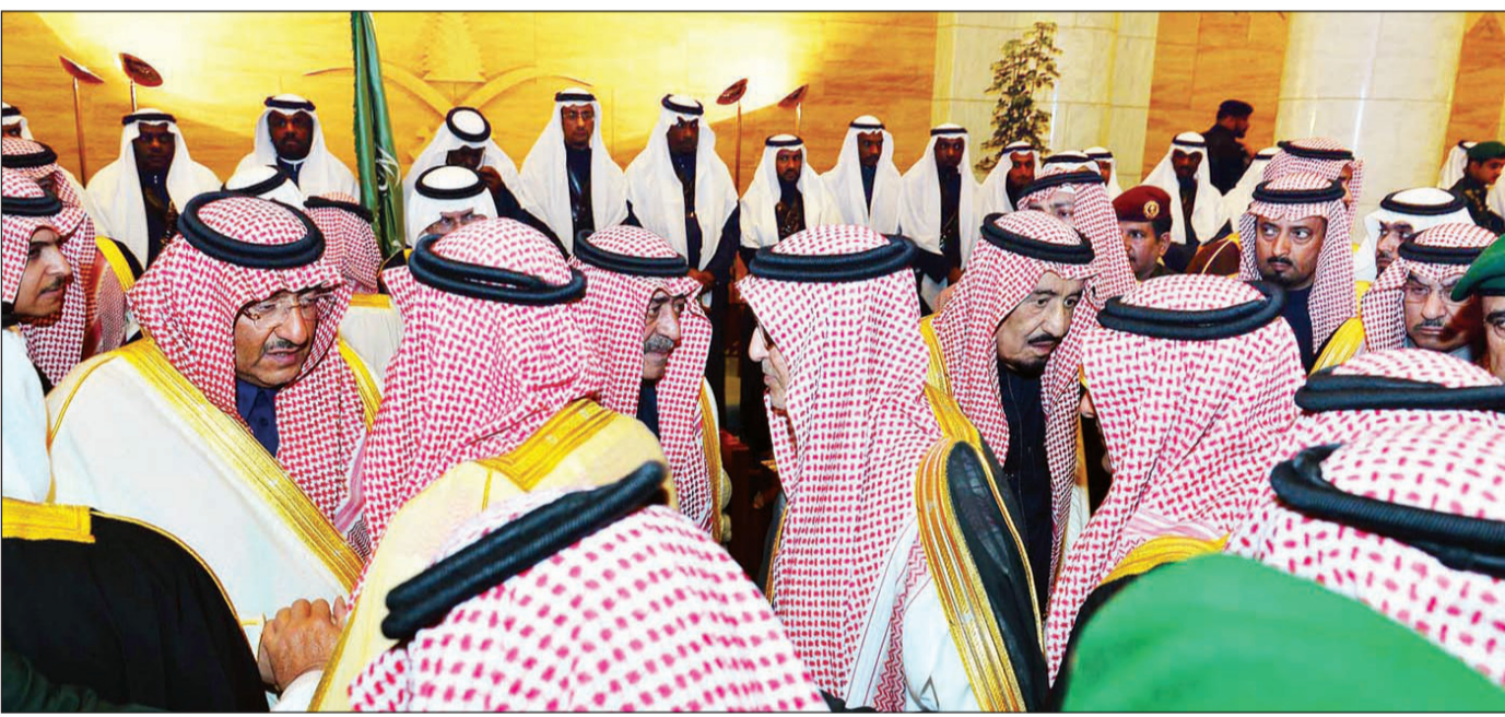
الملك سلمان والأمير مقرن والأمير محمد بن نايف يتلقون البيعة من مختلف شرائح الشعب السعودي