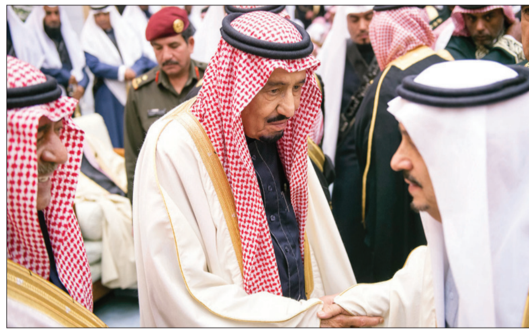
خادم الحرمين تلقى البيعة في مشهد يؤكد التلاحم والمحبة بين القيادة والمواطنين