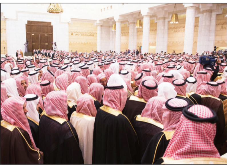
مشهد البيعة مهيب يحمل دلالات تؤكد قوة أركان الدولة السعودية