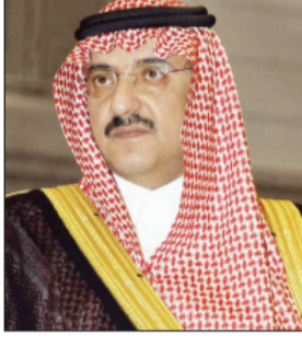
الأمير محمد بن نايف العرب والمسلمين والحفاظ على الأمن والسلام الدوليين. وقال سموه "إن عزاء الشعب

السعودي والأمم العربية والإسلامية والمجتمع الدولي في هذا المصاب الجلل هو في خلفه سيدي خادم الحرمين الشريفين الملك سلمان بن عبدالعزيز آل سعود بكل ما يتصف به -حفظه الله وعاه من عمق سياسي.. وسداد في الرأي.. وبعد في النظر وتجربة طويلة في مجال الحكم والإدارة" وأعرب سموه عن اعتزازه بالثقة التي أولاها إياه الملك سلمان. (كلمة محمد بن نايف: ص ٢٨)