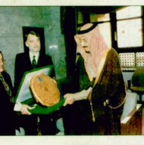
الرياض - صالح الفالح - واس، تسلم صاحب السمو الملكي الأمير سلمان بن عبد العزيز أمير منطقة الرياض درع الأمم المتحدة المقدم إلى حكومة خادم الحرمين الشريفين الملك فهد بن عبد العزيز وسمو ولي عهده الأمين تقديرًا لجهود ومبادرات الملكة العربية السعودية للتخفيف من وطأة المعاناة في مختلف مناطق العالم وذلك بمناسبة السنة الدولية للقضاء على الفقر. البيعة ص 27