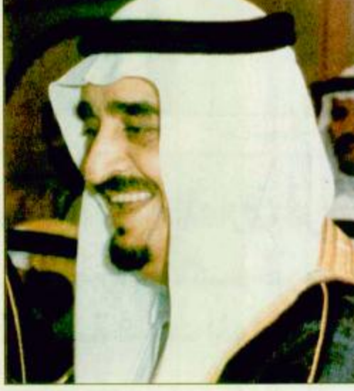
سنوات الخير بقلم: د. ثريا العريض ص 5

بيروت - مكتب الجزيرة - محمد الشامي، «مبادرة من خادم الحرمين الشريفين الملك فهد بن عبد العزيز آل سعود يعود الشيخ خليفة بن حمد آل ثاني إلى دياره ويجتمع شمل العائلة الواحدة وذلك بعد انتهاء مؤتمر قمة الدول الخليجية. هذا ما صرح به له الجزيرة سفير دولة قطر في لبنان السيد محمد علي النعيمي في حديثه لهيئة تحرير مكتب الجزيرة في بيروت عند زيارتهم له في مقر السفارة القطرية. وأضاف أن هذه المبادرة الطيبة تدل على الجهود الحميدة التي يقوم بها خادم الحرمين الشريفين والتي تندرج في إطار جمع شمل العائلة الواحدة وقال أنه ليس غريباً على خادم الحرمين الشريفين أن يقوم بمثل هذه المبادرة لأننا ندرك تماماً من خلال أعماله الطيبة أنه يتعامل مع المحيط البيعة ص 27