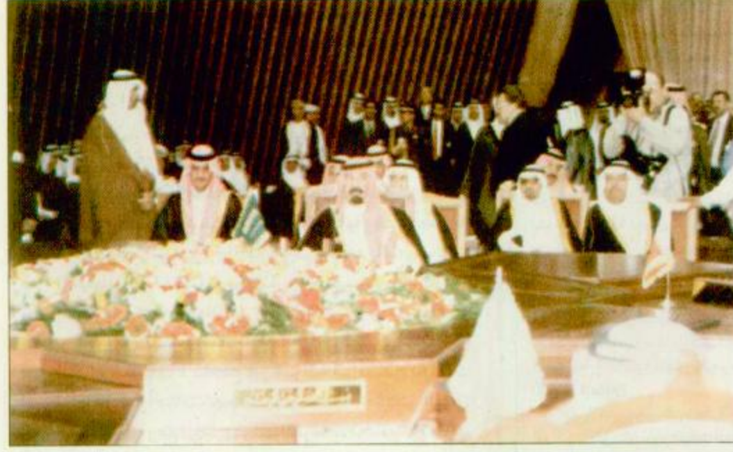
سمو ولي العهد يرأس وفد المملكة في القمة صورة خاصة بالجزيرة - من ق. ن. ١

الدوحة - بعثة الجزيرة، افتتح سمو الشيخ حمد بن خليفة آل ثاني أمير دولة قطر مساء أمس الدورة السابعة عشرة للمجلس الأعلى للتعاون لدول الخليج العربية بقاعة المؤتمرات الكبرى بفندق شيراتون الدوحة. والقي سموه كلمة تناول فيها خطوات تحقيق التكامل بين دول المجلس وتعزيز مسيرته وتوثيق التعاون بين شعوبه. ونيابة عن خادم الحرمين الشريفين الملك فهد بن عبد العزيز آل سعود وصل إلى الدوحة صاحب السمو الملكي الأمير عبد الله بن عبد العزيز ولي العهد ونائب رئيس مجلس الوزراء ورئيس الحرس الوطني بعد ظهر أمس ليؤسس وفد المملكة إلى مؤتمر القمة. ولدى وصول سموه إلى العاصمة القطرية أعرب عن أمله في أن يكون مؤتمر القمة لقادة دول مجلس التعاون الخليجي الذي بدأ أعماله مساء أمس في العاصمة القطرية (الدوحة) محققاً لما فيه الخير لشعوب دول المجلس ولشعوب امتنا الكبرى.. وقال: نحن في هذا الجزء الهام من العالم العربي والإسلامي ركاب سفينة واحدة وأهل بيت واحد لا يمكن لنا ولا زمان في ذاكرة التاريخ خارج هذا الواقع. وقال سموه الكريم: وما حضورنا في هذا الامتداد لامتنا واستشراف مستقبلنا الكريم.. اتينا لنسمع ونسمع ولا نقول لكثافتنا فتدأ الأحداث من حولنا في هذه المنطقة أو فيما هو بعيد عنا تتضاعف اهتماماتنا بها فهي أحداث لا تحتاج إلى من يفسرها أو يعطلها لانها تنعش ذاتها بمعزل عن التكهنات وضروب الفن أو التأويل ننشدها تكبر وتتسع على الساحة العربية والإسلامية بل في العالم اجمع. رسالة الدوحة..... نص تصريح سمو ولي العهد وتفصيل مصور ص 24 و 25