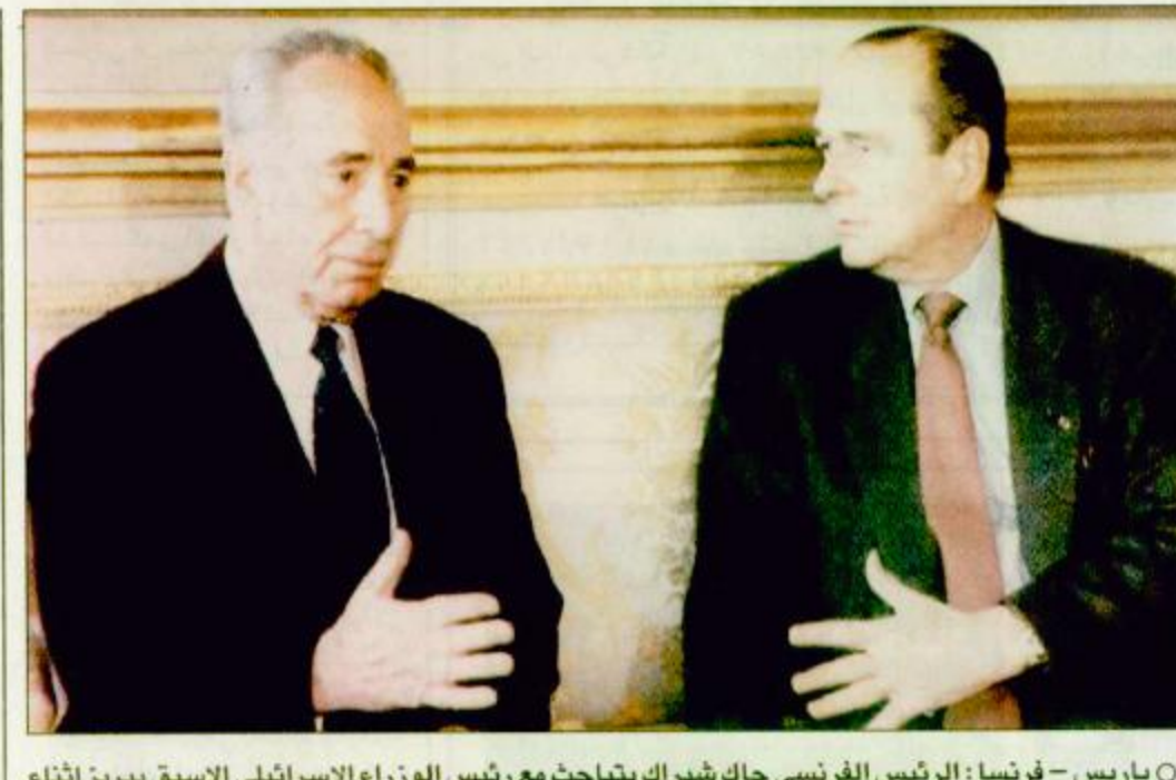
باريس - فرنسا: الرئيس الفرنسي جاك شيراك يتباحث مع رئيس الوزراء الإسرائيلي الاسبق بييريز اثنا الاجتماع الذي عقد بينهما في قصر الاليزيه، وتركزت المباحثات على عملية السلام في الشرق الاوسط

الخرطوم - أنش.أ، أعلنت حالة الطوارئ بولاية كسلا السودانية الحدودية الشرقية مع اريتريا وتم استدعاء قوات عمليات الولاية لصد أي هجوم اريتري محتمل. وذكر التلفزيون السوداني في نيابته الليلة قبل الماضية ان اللواء معاش ابو القاسم ابراهيم محمد والي كسلا قد اصدر قراراً أعلن بموجبيه حالة الاستنفار لمواجهة التحرشات الاريترية كما تم اتخاذ الاستعدادات لمكافحة عمليات التخريب بحصر المناطق التي زرع فيها المعارضون العسكريون الانغام لآزالتها وسد المنافذ والشفرات التي يتسلل منها هؤلاء. وكان المجلس النيابي لولاية كسلا قد البيعة ص 27