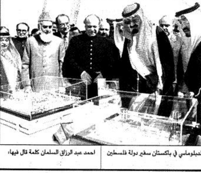
الملك فيصل بن عبد الله في باكستان سفير دولة فلسطين احمد عبد الرزاق السلطان كلمة قال فيها،

الشكر كما با صاحب السمو نوبلة عن زملائي ويسمي تكراراً لخص التقدير على ان مستضوناً من وفكم الذين فرصة هذا اللقاء الطيب التي اتسم بالصرامة ونحن ندرك ان جهودكم اللوفقة ومواقف المملكة من جميع قضايا العرب والسلمين تدعو إلى الفخر والاعتزاز وهذا ليس بمستغرب على المملكة العربية السعودية لانها قلب العالم الإسلامي ومهبط الوحي وهي عربية في كل منهج ومسلحة في كل مسار ودفاعها عن قضايا العرب والسلمين مشهود في كل الحافل الدولية منذ زمن بعيد. ارجو يا صاحب السمو نقل تحياتنا جميعاً لخادم الحرمين الشريفين الملك فهد بن عبد العزيز وامتزازنا بحكومة المملكة العربية السعودية وشعبها العظيم وامتزازنا وفخرنا بسموكم الكريم وبمواقفكم الخيرة وجهودكم للسلامة على كافة الأصعدة. وحضر الاستقبال الوفد الرسمي الرفيق.