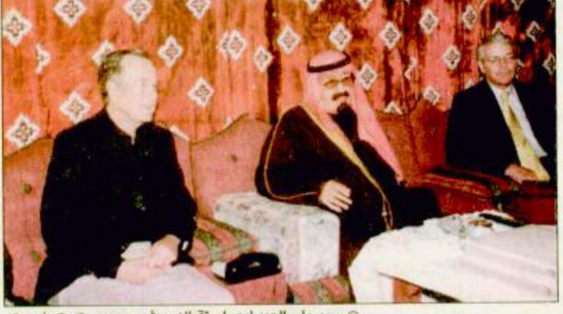
سمو ولي العهد وحضر الاستقبال وحفل لجمال الأوضاع الدولية الراحمة. سمو ولي العهد وحضر الاستقبال وحفل وقد تناول الضيفان طعام الغداء على مائدة الغداء. طلح ص، الجقية ص، ٢٩.

الرياض-واس: استقبل صاحب السمو الملكي الأمير عبدالله بن عبدالعزيز ولي العهد نائب رئيس مجلس الوزراء ورئيس الحرس الوطني أمس في مخيم سموه خارج مدينة الرياض فخامة الرئيس الأمريكي السابق جورج بوش ودولة رئيس الوزراء البريطاني السابق جون ميجور والوفد المرافق لهما اللذين يزوران المملكة حالياً للمشاركة في المنتدى الاقتصادي الأول تحت عنوان «تحقيق نمو مستقر في ظل عولة الاقتصاد» الذي تنظمه الغرفة التجارية الصناعية بمحافظة جدة بمشراكة جامعة هارفارد الأمريكية. ويشترك في المنتدى نخبة من رجال الأعمال من داخل المملكة وخارجها. ويجري خلال الاستقبال استعراض شامل