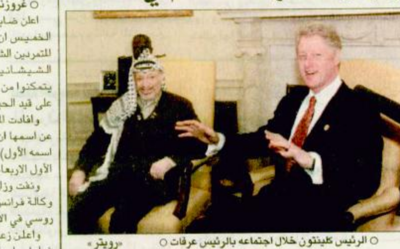
الرئيس عرفات خلال اجتماعه بالرئيس عرفات

واشنطن-عمان-ق.ن.أ: تحدثت مائدة مع مادلين أولبرايت وزيرة الخارجية الأمريكية دعت خلالها الجانبين الإسرائيلي والفلسطيني إلى إبداء المزيد من المرونة بشكل يعزز للولايات المتحدة تركزت حول تطورات عملية السلام على المسار الفلسطيني الإسرائيلي ولإسماها العقبان التي تعترض هذه السيرة. وكان الرئيس الفلسطيني قد أجرى