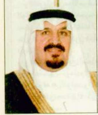
الأمير سلطان بن عبدالعزيز

الرياض-واس: قدم صاحب السمو الملكي الأمير سلطان بن عبدالعزيز النائب الثاني لرئيس مجلس الوزراء وزير الدفاع والطيران والمفتش العام تبرعاً مالياً لاستكمال تجهيزات قسم الغسيل الكلوي في مستشفى سكاكا المركزي من بينها ثلاث وحدات غسيل كلوي وأخرى منتقل لمرضى العناية المركزة. وقد تلقى معالي وزير الصحة الدكتور سامع بن عبدالعزيز شبكشي شكراً بخيمة التبرع وقد أعرب معاليه عن شكره وتقديره لصاحب السمو الملكي الأمير سلطان بن عبدالعزيز.