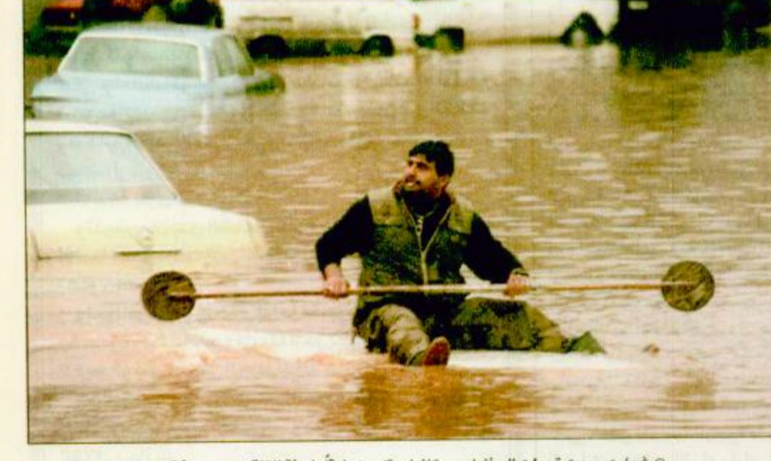
شوارع بيروت تحولت إلى أنهار وسكانها يتكثرون طرقاً بترية للتلقت

بيروت-عمان-الوكالات: حولت الأمطار الغزيرة التي هطلت في لبنان أمس الخميس الطرقات والأحياء إلى مستنقعات متسبية في أضرار مادية جسيمة بحسب وسائل الإعلام الخاصة. ولم تقدم الأجهزة الرسمية حصيلة الأضرار غير أنها شكت «خلية تدخل سريع» لمساعدة الأهالي كما أنها لم تقدم مساء أمس عن وقوع ضحايا. وغمرت المياه منازل ومتاجر وميادين رسمية في العديد من أحياء بيروت وضاحيتها حتى أنها دخلت إلى مستشفى ومسجد في طرابلس كبرى مدن لبنان الشمالي كما أعلن التلفزيون اللبناني الرسمي. ولم يسجل أي خلل في حركة الطيران في مطار بيروت غير أن العاصمة أسفرت عن انقطاع التيار الكهربائي في ضاحية بيروت وفي الجبل. وافتتح تلفزيون «اللمحة اللبنانية للإرسال» نشرته بعبارة إنها كارثة، محملاً السلطات مسؤولية الأضرار الناجمة عن هذه العاصفة المرتقبة. أما تلفزيون المنار الناطق باسم حزب الله والذي بث صوراً للاحياء التي غمرتها المياه في ضاحية الجقية ص، ٢٩.