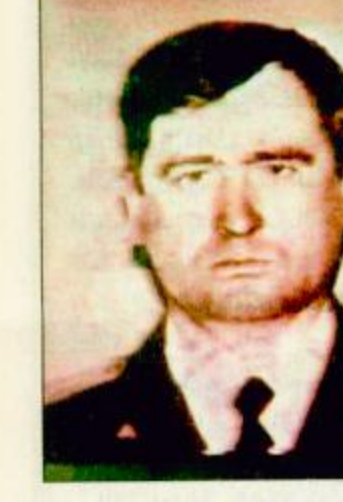
الجنرال الروسي الأسير

غروزني-موسكو-أ.ف.ب-واس: أعلن ضابط روسي لوكالة فرانس برس أمس الخميس أن ضابطاً روسياً وقع في أسر المتمردين الشيشان الذين يقاتلون في العاصمة الشيشانية الحاصرة غروزني من دون أن يتمكنوا من تحديد ما إذا كان الجنرال لا يزال على قيد الحياة. وأفادت المصادر نفسها التي رفضت الكشف عن اسمها أن الجنرال مالايفيف (الذي لم يذكر اسمه الأول) كان يقود عملية في غروزني في الأول الأربعة، حين وقعت وحدته في كمين. ونفت وزارة الدفاع الروسية رداً على أسئلة وكالة فرانس برس من موسكو وقوع جنرال روسي في الأسر في غروزني. وأعلن زعيم الحرب الشيشانية الرئيسي شامل باساييف أمس الخميس للتلفزيون الشيشاني اعتقال الجنرال الروسي قائلاً: «إنه معتقل في مكان آمن ويجري استجوابه حالياً». ومن ناحية أخرى اعترف القادة العسكريون الروس أمس بصحور ثلاثة وعشرين جندياً روسياً في القتال الأخير للقوات الروسية ضد المقاتلين الشيشان في غروزني. وذكرت شبكة سبي إن، الإخبارية الأمريكية أمس أن القوات الروسية تعاني بشدة من عمليات