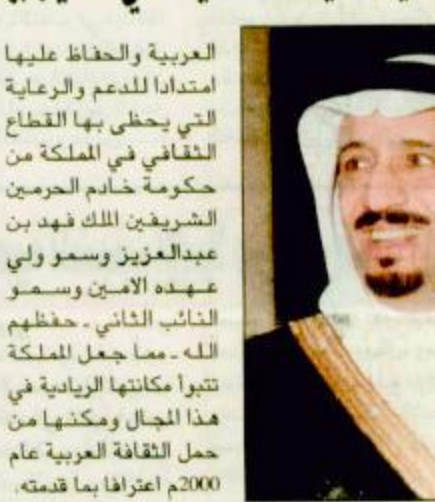
الأمير سلمان بن عبدالعزيز

الرياض-واس: يرعى صاحب السمو الملكي الأمير سلمان بن عبدالعزيز أمير منطقة الرياض مساء يوم غد السبت حفل انطلاق برامج الرياض عاصمة الثقافة العربية وذلك بقاعة المؤتمرات الرئيسية بالرئاسة العامة لرعاية الشباب. أعلن ذلك صاحب السمو الملكي الأمير سلطان بن فهد بن عبدالعزيز الرئيس العام لرعاية الشباب ورئيس اللجنة العليا لتنظيم برامج الرياض عاصمة الثقافة العربية. وأعرب سموه في تصريح لوكالة الأنباء السعودية بهذه المناسبة عن شكره وامتنانه لصاحب السمو الملكي الأمير سلمان بن عبدالعزيز أمير منطقة الرياض على رعاية سموه الكريمة لحفل انطلاق برامج الرياض عاصمة الثقافة العربية. وراى سمو الرئيس العام لرعاية الشباب أن رعاية سمو أمير منطقة الرياض لهذه التظاهرة الثقافية تجسد الدور الريادي للمملكة في نشر الثقافة