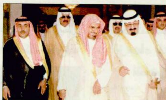
وصول سمو ولي العهد إلى العاصمة المقدسة