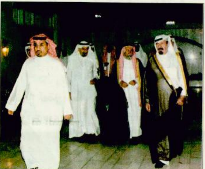
سموه والأمراء في حفل الأمير متعب

بمناسبة زيارته لهذا المخيم بعد أن حول إلى منتزه مزود بوسائل الترفيه والراحة واللعب للأطفال لمن يقصده من المواطنين.