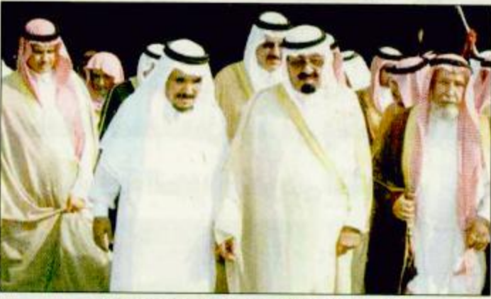
الأمير عبدالله بشرّف حفل الشيخ سلطان بن جيهان