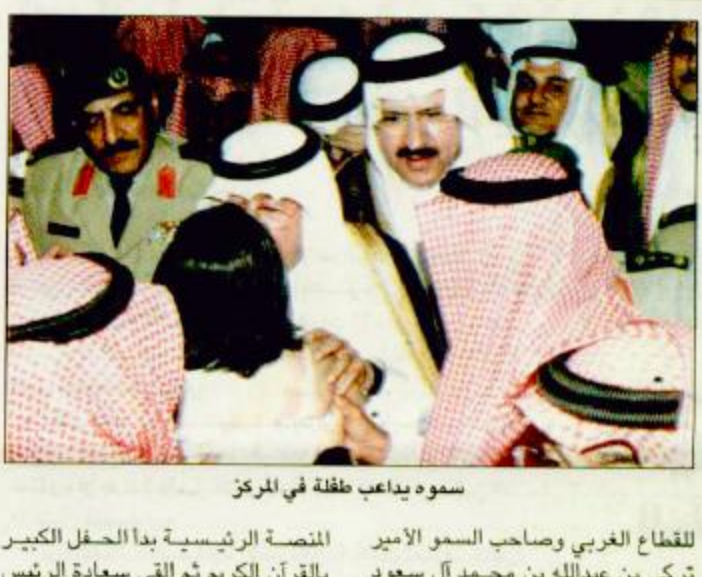
سموه يداعب طفلة في المركز

عشيرة - عليان آل سعدان - سعد الخرجي - عميد الهادي الربيعي - واس: