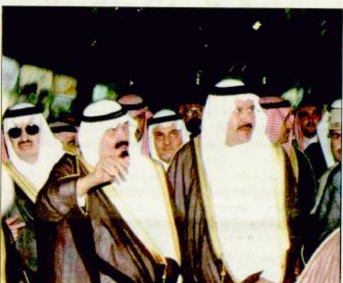
الأمير عبد الله يحيي المواطنين في مركز العبيكان