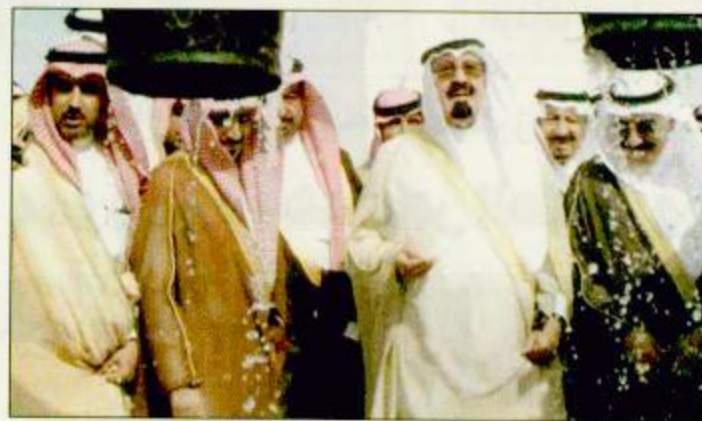
زيارة سمو ولي العهد لمنتزه مخيم الملك عبدالعزيز