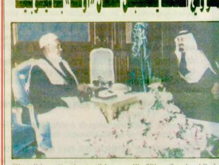
استقبل صاحب السمو الملكي الأمير عبد الله بن عبد العزيز نائب رئيس مجلس الوزراء ورئيس الحرس الوطني في مكتب سموه في الديوان الملكي بقصر اليمامة بعد ظهر أمس الشيخ

قاطع ممثلون من التحالف الوطني الصومالي وهو الحزب الذي يرأسه محمد فرح عبيد قائد الصرب في الصومال أمس الاثنين افتتاح المؤتمر الخاص بالصومال الذي تنظمه الامم المتحدة.