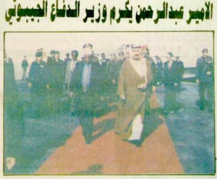
صاحب السمو الملكي الأمير عبد الرحمن بن عبد العزيز نائب وزير الدفاع والطيران والمفتش العام. وكان في استقبال معاليه بالانبار

كان ذلك بطريق غير مباشر. واستشهد كل الأطراف من خلال الحوار الموسع الاتفاق على كل القضايا الأساسية. لكنه اصناف لا بد من تسازلات متبادلة باتت معروفة للطرفين. وكان الحوار بين الاحزاب اليمنية الذي يهدف الى مزج قنبل أسوأ أزمة سياسية تهدد بالخطر وحدة اليمن التي مضى عليها ثلاث سنوات قد تأجل يوم الاحد لأجل غير مسمى. وقال احد اعضاء البرلمان ان الخلافات القائمة بين حزب المؤتمر الشعبي العام برئاسة الرئيس علي عبد الله صالح وبين الحزب الاشتراكي بزعامة البيض تشكل الآن تهديداً حقيقياً لوحدة اليمن. وقال ان اليمن يعرض بقدار كبير في الأزمة السياسية. وأضاف انه لا يمكن استبعاد شيء من الفاحشة العنيفة حتى مسألة الانفصال أو الحرب الأهلية.