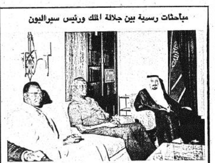
مباحثات رسمية بين جلالة الملك ورئيس سيراليون الرياض - واس عقدت المباحثات الرسمية بين جلالة الملك خالد وفخامة الرئيس سيراليون جيمس مانغباردي في مدينة الرياض صباح اليوم. حضر الاجتماع صاحب السمو الملكي الأمير فهد بن عبد العزيز ونائب رئيس مجلس الوزراء الأمير فيصل بن عبد العزيز ونائب رئيس مجلس الوزراء صاحب السمو الملكي الأمير عبد الله بن عبد العزيز والنائب الثاني لرئيس مجلس الوزراء ورئيس الحرس الوطني ومعالى الشيخ إبراهيم مسعود وزير الدولة والوزير المرافق كما حضره الوفد المرافق لفخامة الرئيس.

قائد اللواء الرابع السوري يقول: بما يتم التوصل إلى الحل عند ما ينسحب الجيوش السوري على أبوابهم